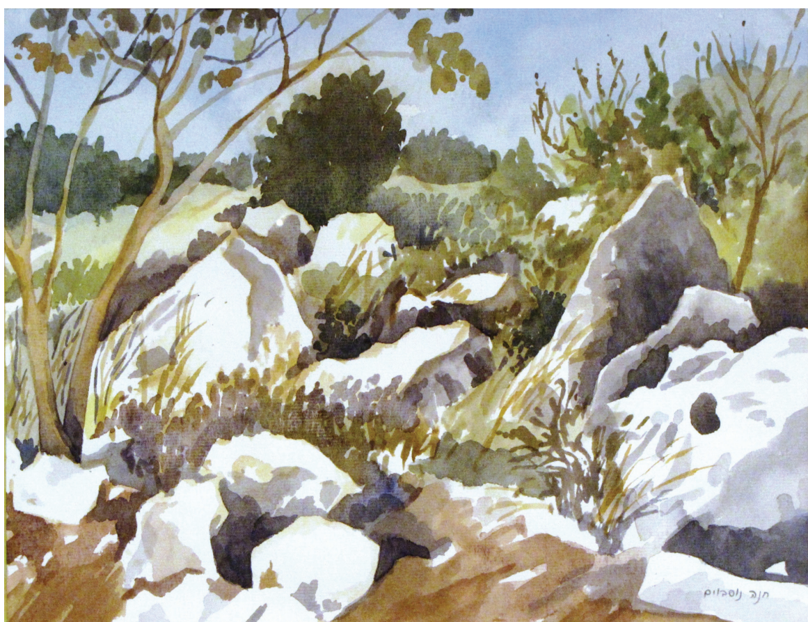
חנה נוסבוים, "מסלעה". צבעי מים על נייר, 32x25 ס"מ.