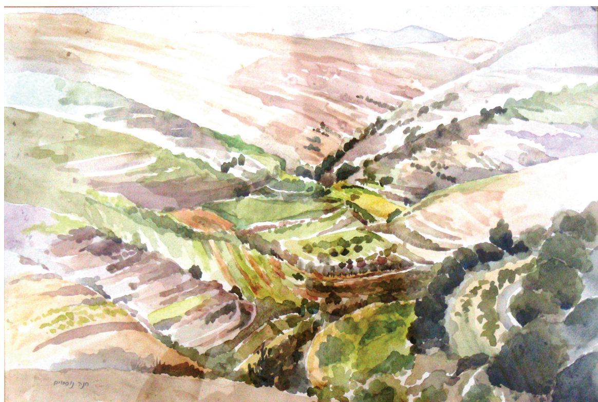
חנה נוסבוים "עמק ירדן". צבעי מים על נייר, 38x56 ס"מ.