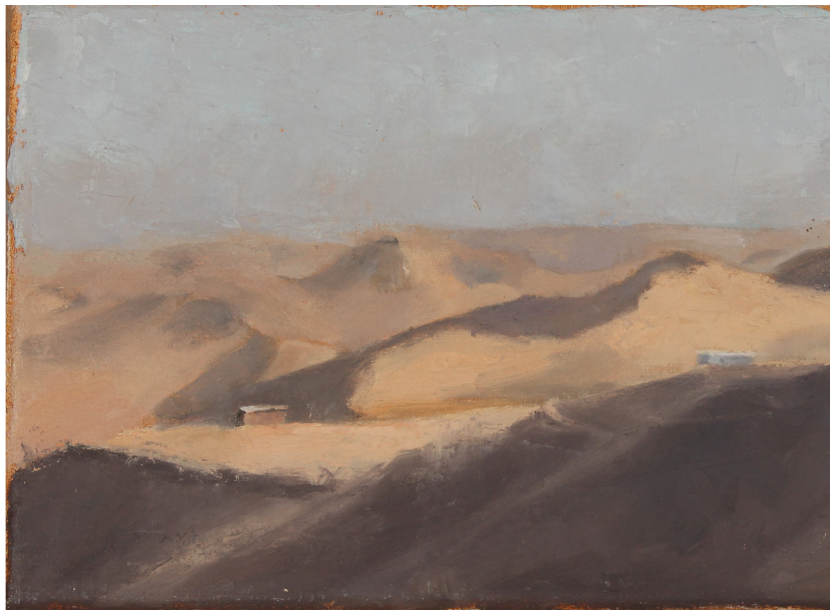
אפרת בינה יוקל, "תקוע די - השתלבותי", שמן על בד, 18x47.5