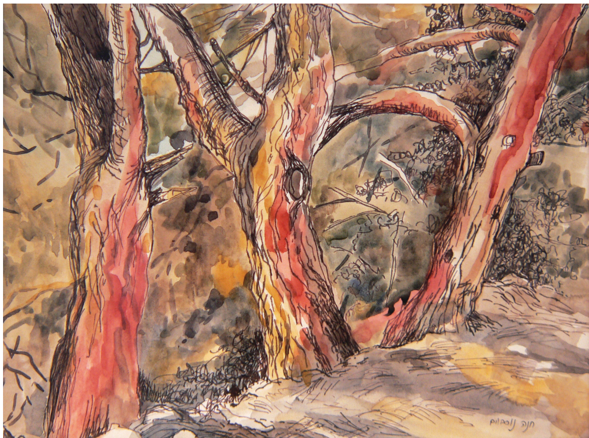
חנה נוסבוים, "שלושה גזעי אורנים". צבעי מים וציפורן ודיו, 32X23 ס"מ.