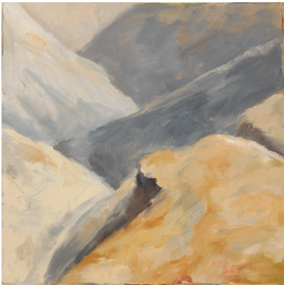
אפרת בינה יוקל, 'מבט אל הוואדי'. שמן על בד, 40X40 ס"מ.