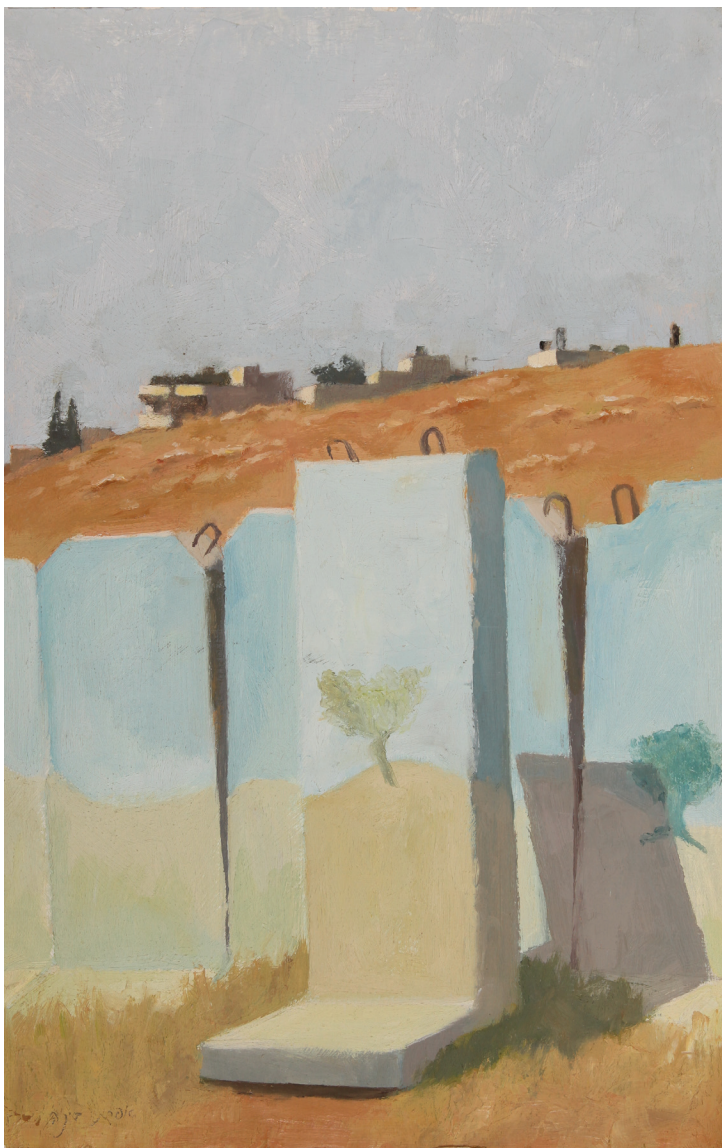
אפרת בינה יוקל, "שכנים מעבר לגדר" 2- "מציאות ודמיון". שמן על בד, 25x40 ס"מ.