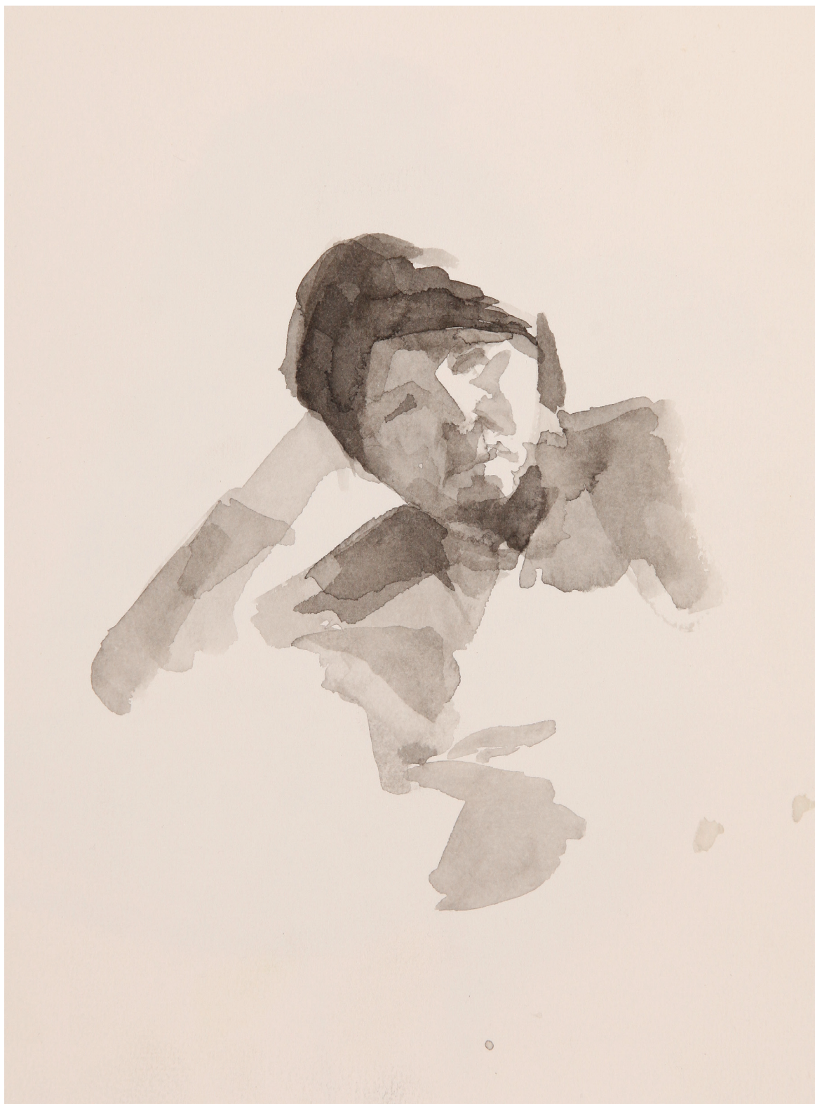
אפרת בינה יוקל, אישהו דיו על נייר, 18X23 ס"מ