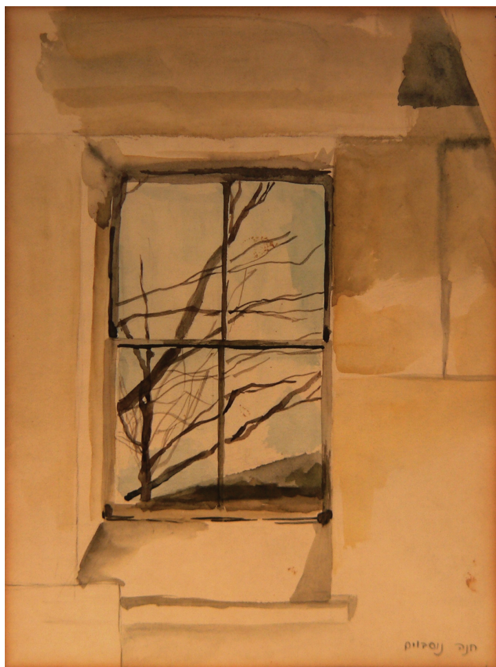
חנה נוסבוים, "חלון בסתיו". צבעי מים, 24x32 ס"מ.

הצמצום – אל מול המרחב שבתוכו הוא נטוע, מחקה את פעולת העין המתכווצת נוכח אורו המציף של המדבר, נותנת עוגן ומסגרת להכיל את האינסוף. הביתי והפראי מצוירים שניהם מתוך קרבה רבה, ומתוך ידיעה עמוקה.