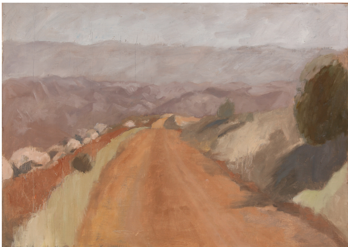
אפרת בינה יוקל, "דרך במדבר". שמן על בד, 70x50 ס"מ.