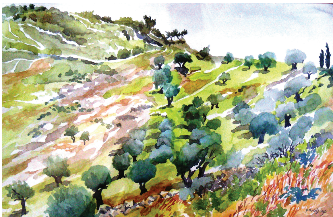
תנה נוסבוים, "עצי זית במורד". צבעי מים על נייר, 35x54 ס"מ.