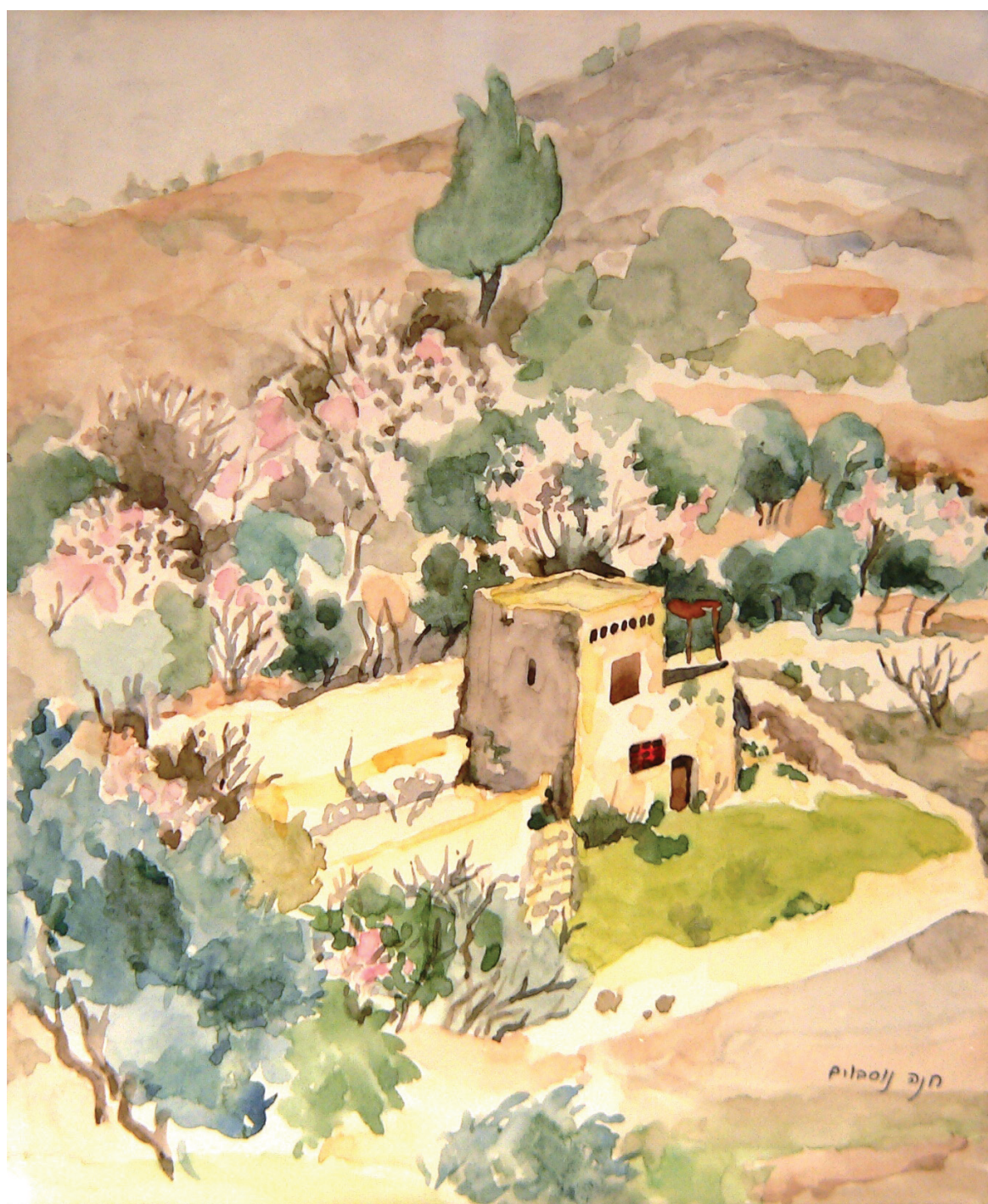
חנה נוסבוים, "חלון בסתיו". צבעי מים, 24x32 ס"מ.