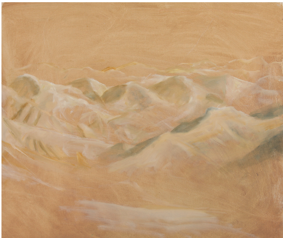
אפרת בינה יוקל, "הרים מרחפים". שמן על בד, 45x50 ס"מ.