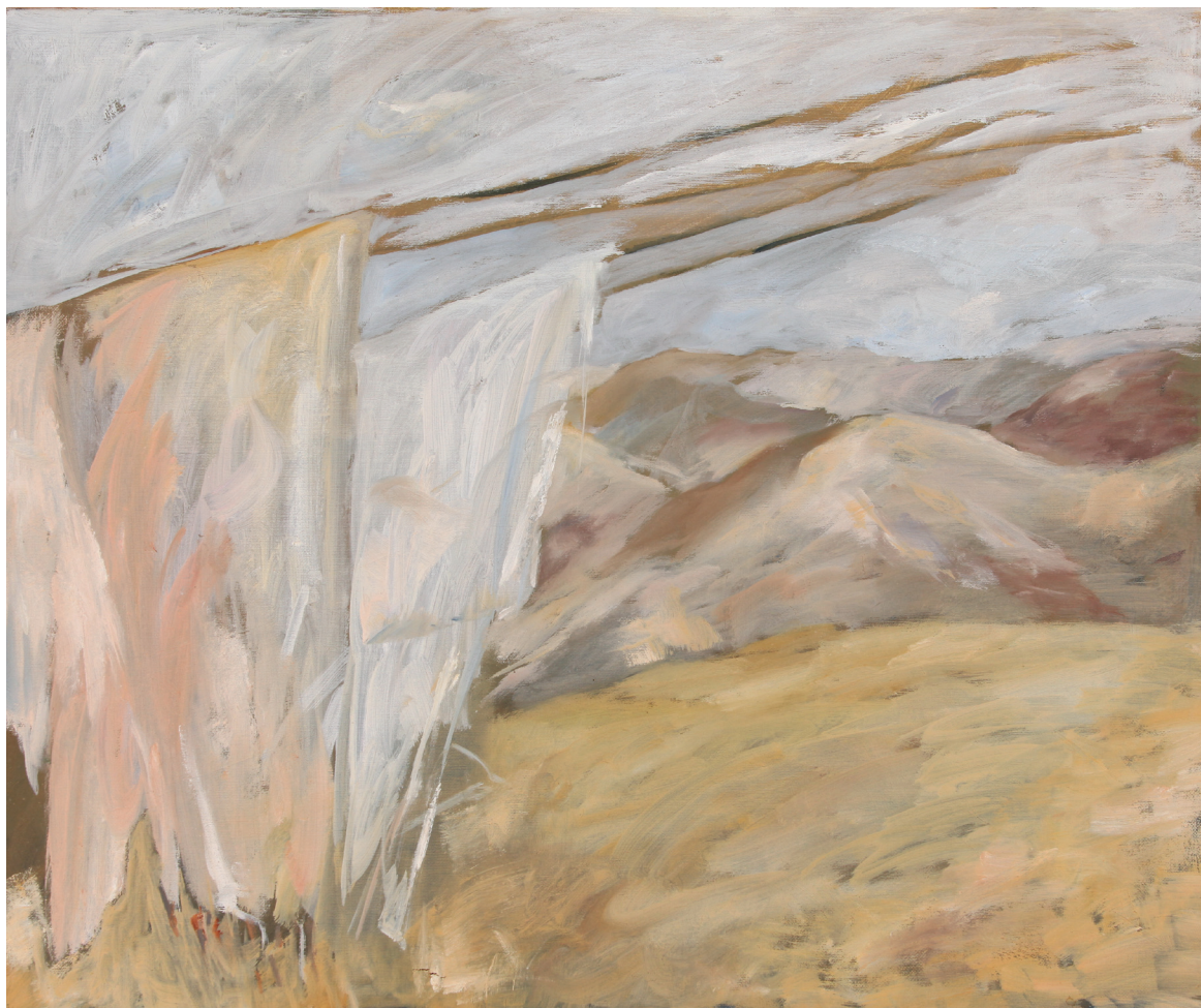
אפרת בינה יוקל, "ציב ומתחלף" 2 - "כביסה צבעונית ומדבר". שמן על בד, 60x50 ס"מ.

בְּכוּחוֹתֵי הָאֲתָרוּגִים אֲנִי זוֹחֶלֶת נְחַרְצֶת לְקִים אֶת הַשְּׂגָרָה עַל אֵף הַכֵּל אֶל חֲבֵלִי חֲבֵלִי כְּבִיסָה פְּשׁוּטִים מְסַכְּסְכִים בְּרוּחַ כְּדֵי לְתַלּוֹת וּלְיִבֵּשׁ אֶת הַעִיצִית שֶׁל בְּנֵי וְגַם פִּתְקָה קְטַנָּה לְתַלּוֹת, שְׂבֵה כְּתוּב רַחֵם