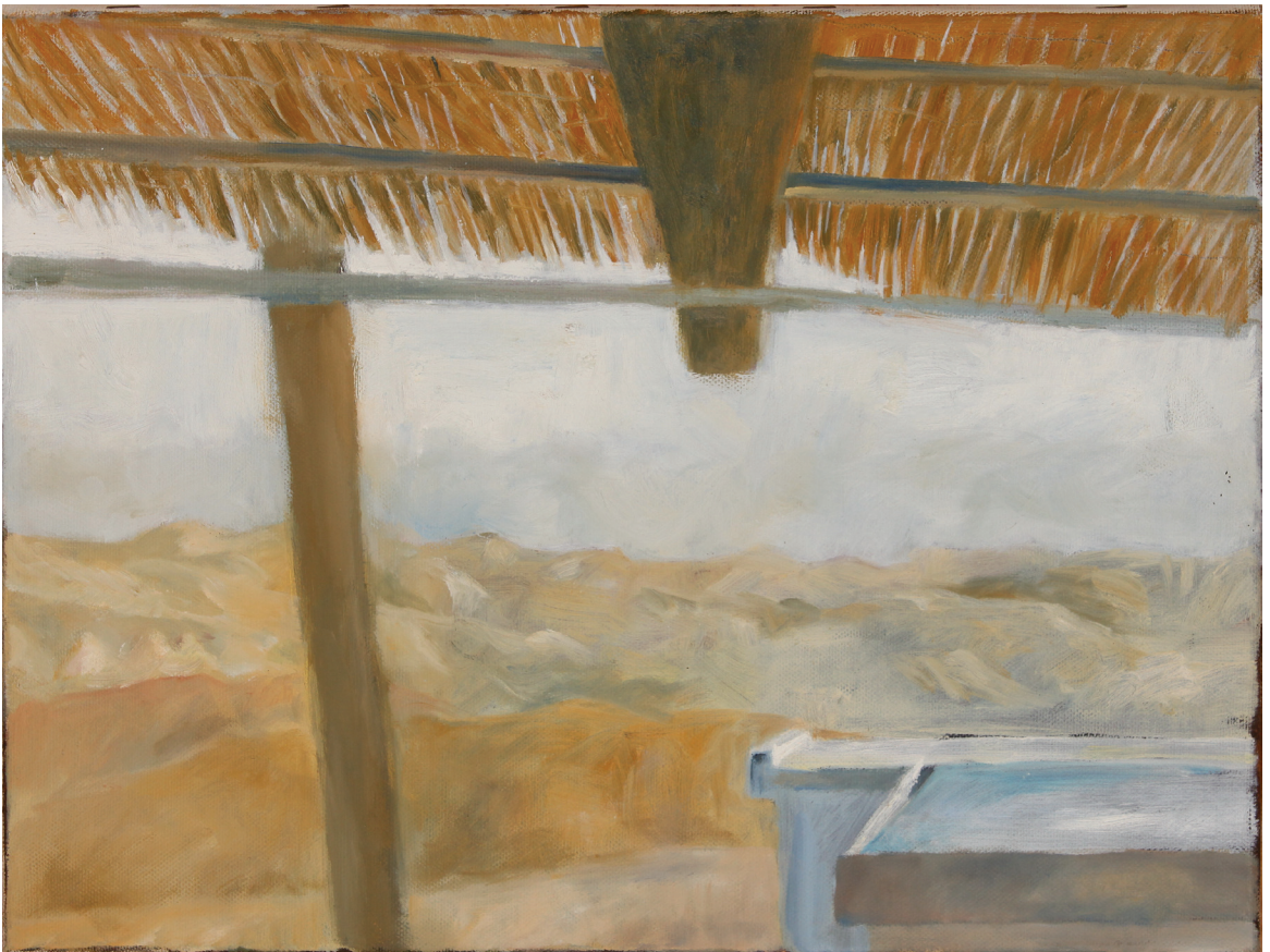
אפרת בינה יוקל, 'סוכה במדבר'. שמן על בד, 29.5X39.5 ס"מ.