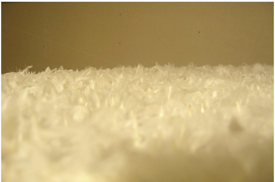
שולמית עזיון, 'נוצות', בד נול, מסגרת עץ ונוצות, 70x90, 2009.