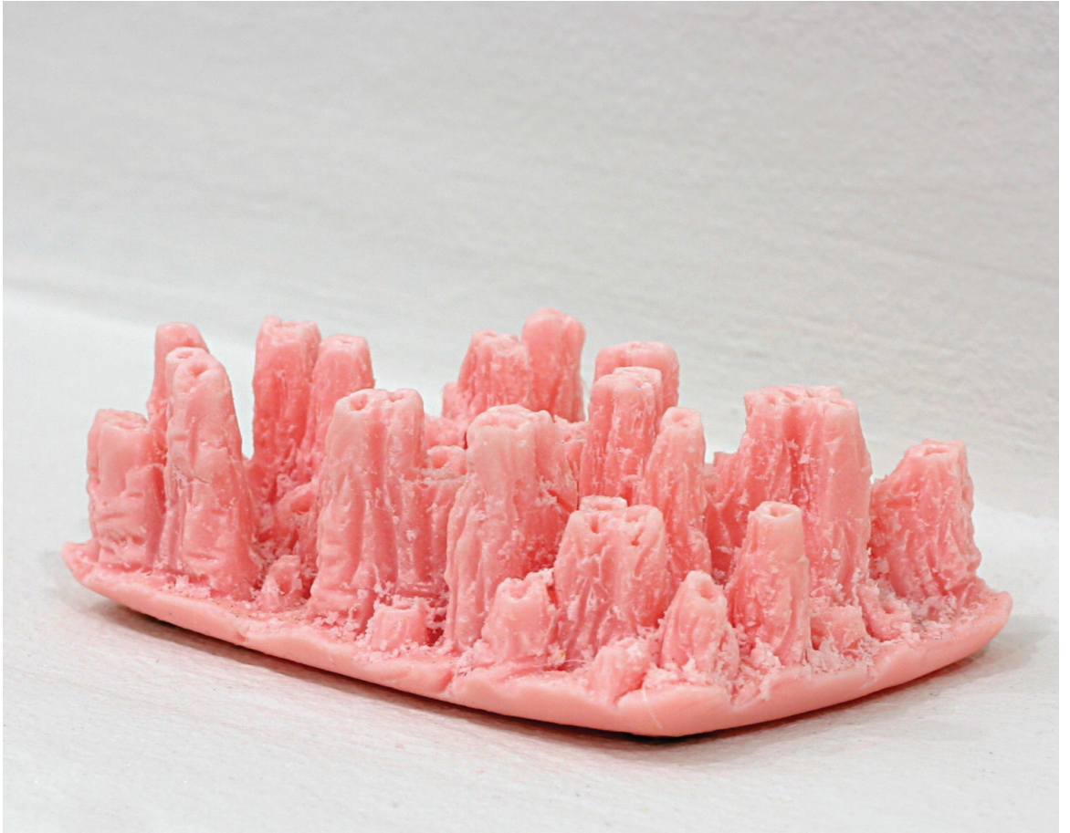
מוריה אשכנזי-רוזנבלום, 'קו אפס', סבון.