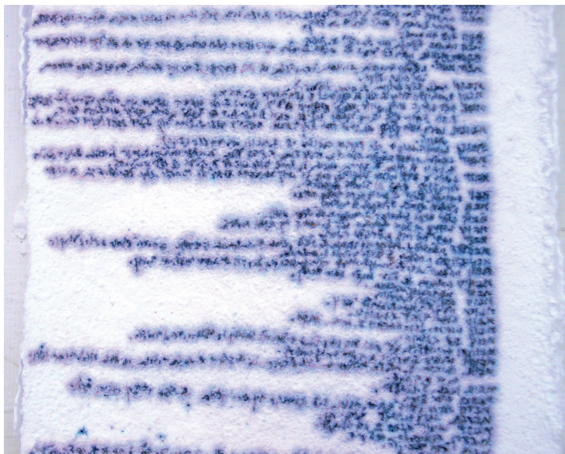
מוריה אשכנזי-רוזנבלום, 'מלים', דיו על מלח.