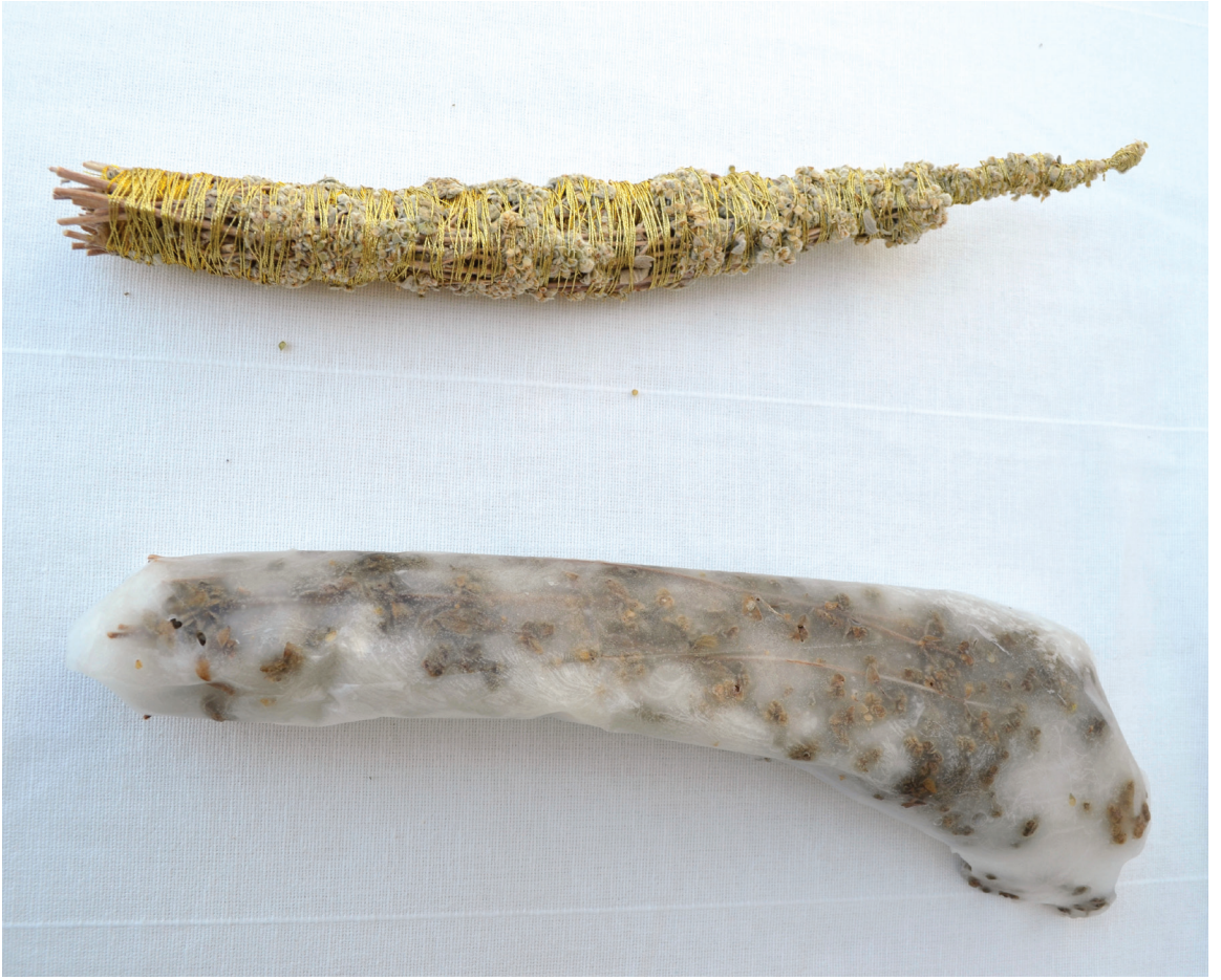
מוריה אשכנזי-רוזנבלום, 'זמן דק', אזור, חוט זהב ופרפין.