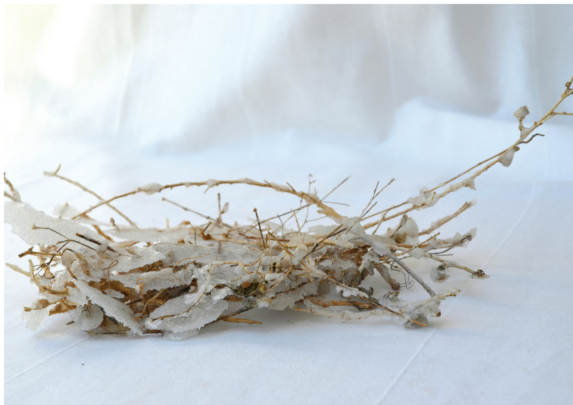
מוריה אשכנזי-רוזנבלום, 'קן ציפור, פרט', קן ציפור עזוב וסוכר.