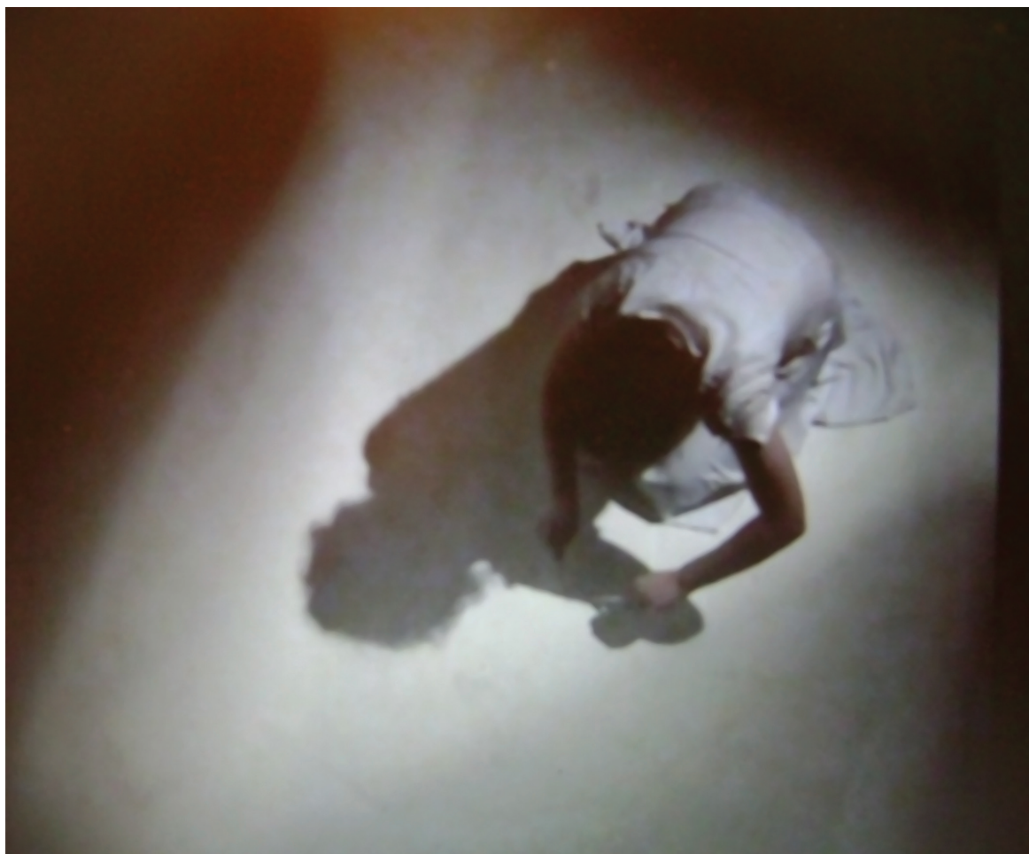
שולמית עציון, 'בלבן', וידיאו ארט, 2009.