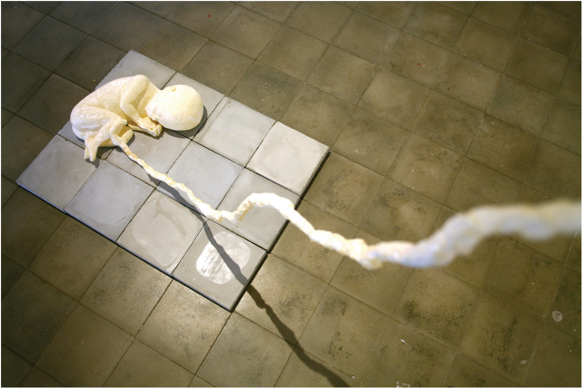
שולמית עציון, 'עובר', נייר, 40x20x10 (וחוט הטבור בגובה החדר), 2012.