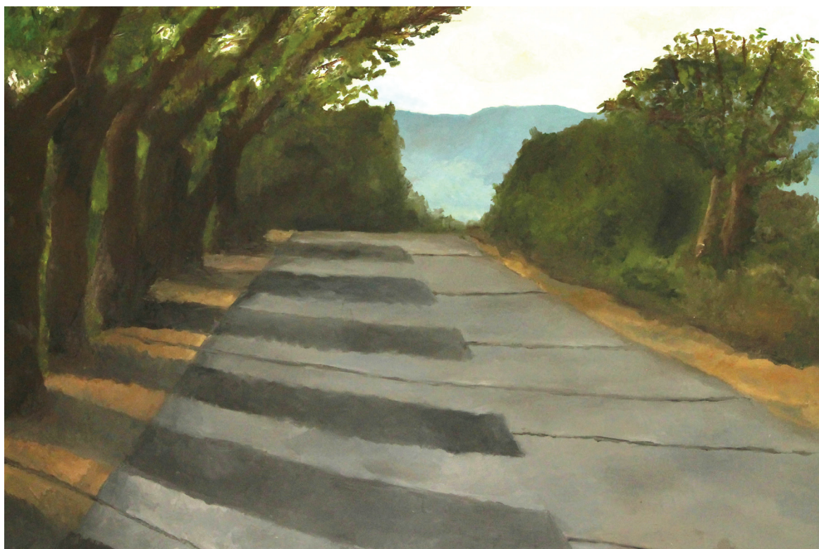
דרך, נעמה שראוב, אולפנת בני עקיבא מירון (המורה: עטרה גבריאל), שמן על קנבס, טכניקה מעורבת, 70 x 90 ס"מ.