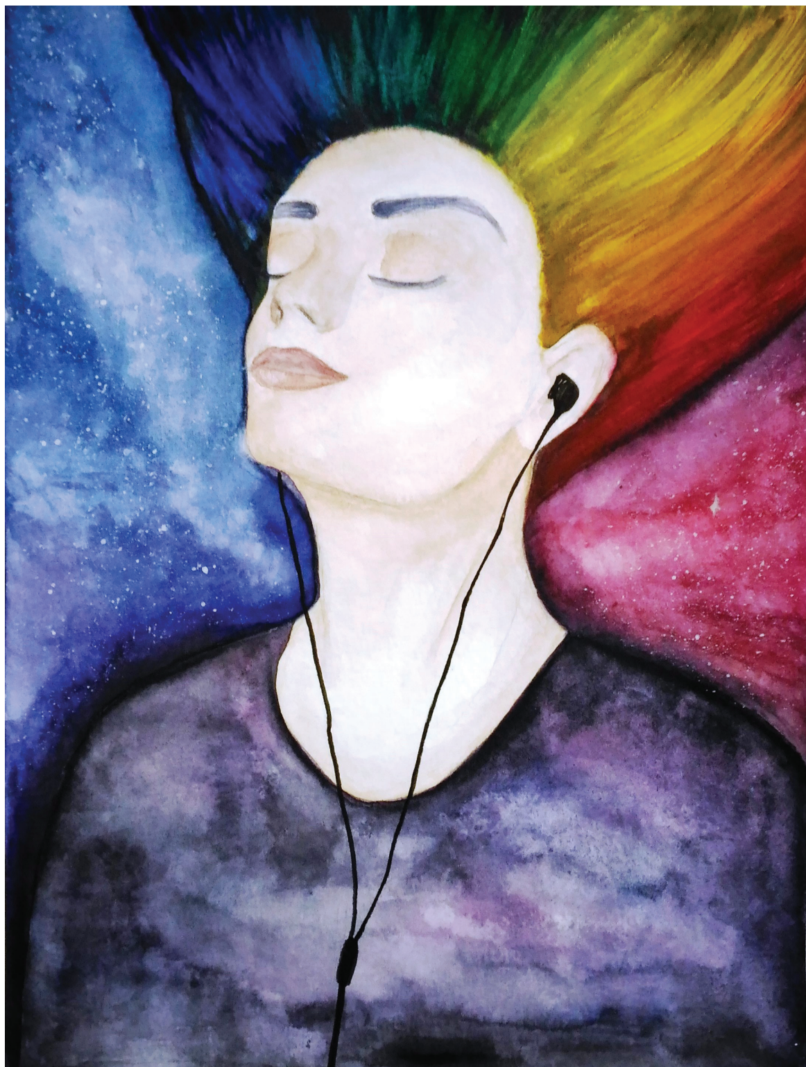
דמיון מעניק לך כנפיים, יעל ניפומניאשצ'י, אולפנת אמיי'ת עירוני ו, חיפה (המורה: רוני גור), צבע מים על נייר, 24 x 32 ס"מ.