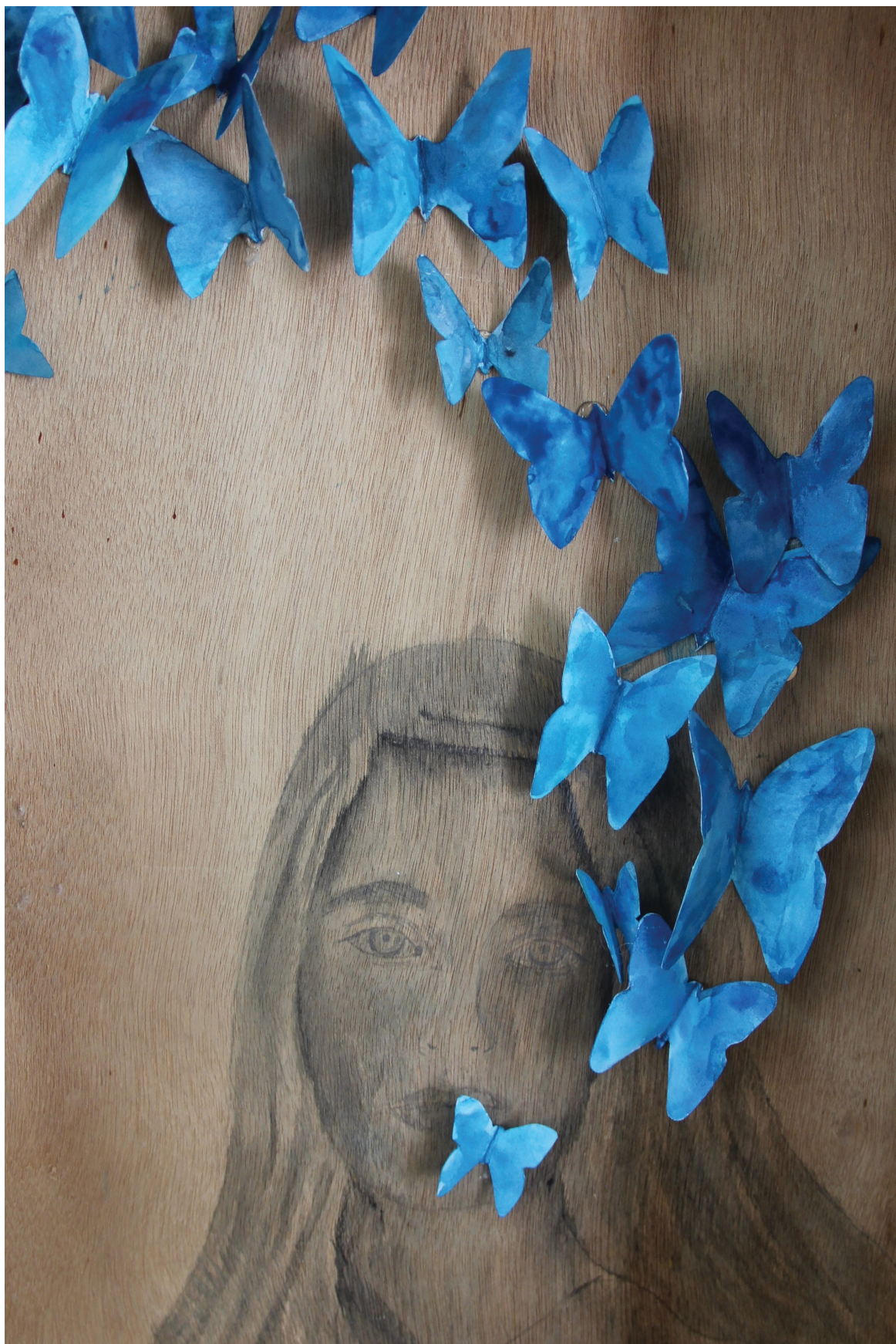
סיפור מסגרת, שחר ילון, אולפנת אמי"ת גבעת שמואל (המורה: הילה סבן), טכניקה מעורבת, 60 x 60 ס"מ.