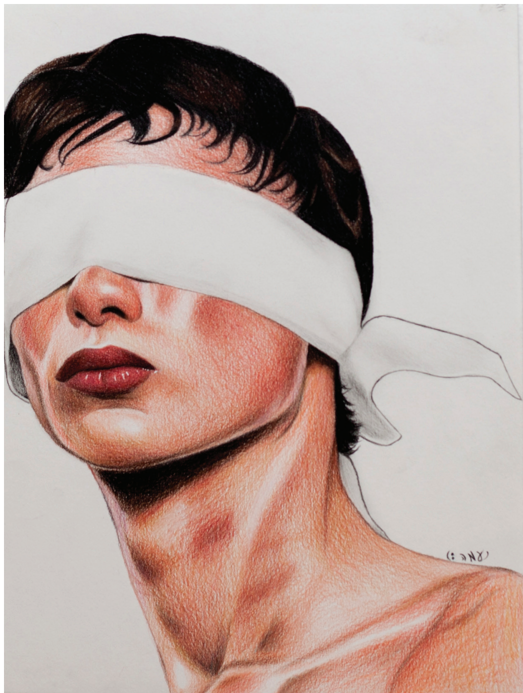
הנסתר, נעמה סרן, אולפנת שעלבים (המורה: אור טושינסקי), רישום על נייר, 40 x 30 ס"מ.