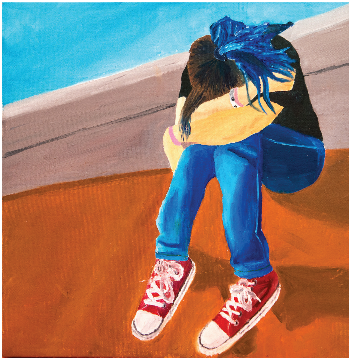
קונצרט, הודיה אזריאל, אולפנת אייל ברמה (המורה: סיגלית תמר בקר), אקריליק על בד, 40 x 60 ס"מ.