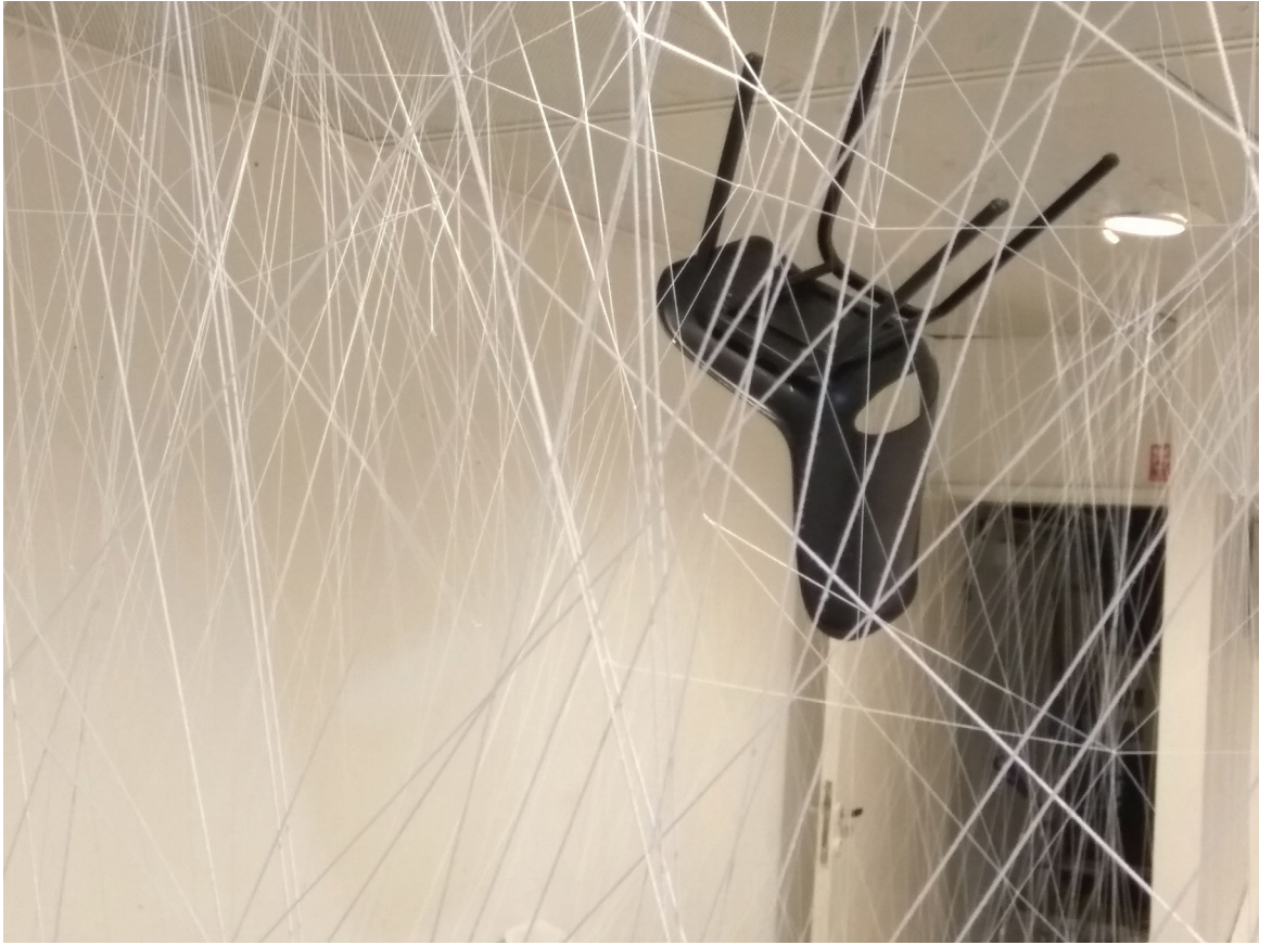
זהירות, גבי אמנט, נווה חנה (המורות: לביאה כהן ונעמה פז), צילום וידאו של מיצב חוטים וכיסאות בחלל 3 x 4 x 5 מטר.