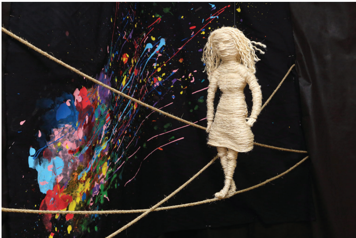
קשורה, שרה שוורץ, אולפנת בני עקיבא טל רמות, ירושלים (המורות: רחל אנטמן ורבקה באשרי), פיסול בחוטי ברזל וחבלים, ציור והשפרצות צבע אקריליק על בד, מטר וחצי על מטר וחצי.