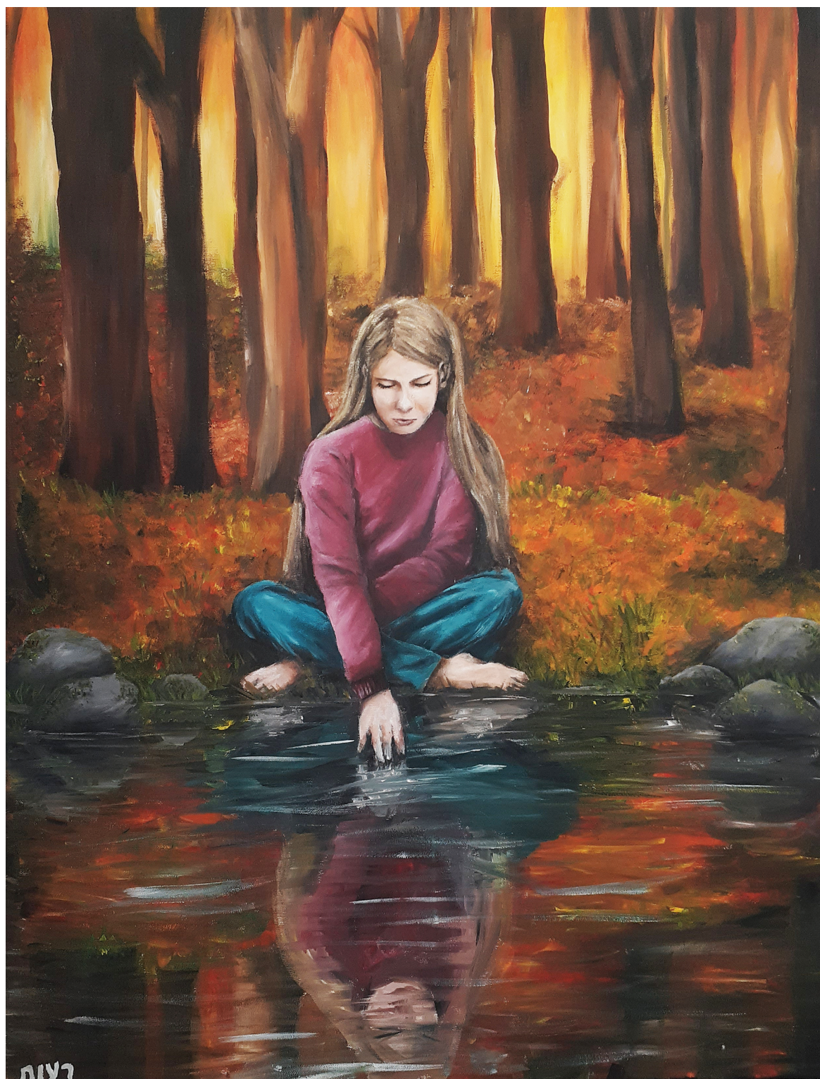
מי אני?, רעות בר שי, אולפנת אורות מודיעין (המורה: מיכל צוף), אקריליק על בד, 70 x 50 ס"מ.