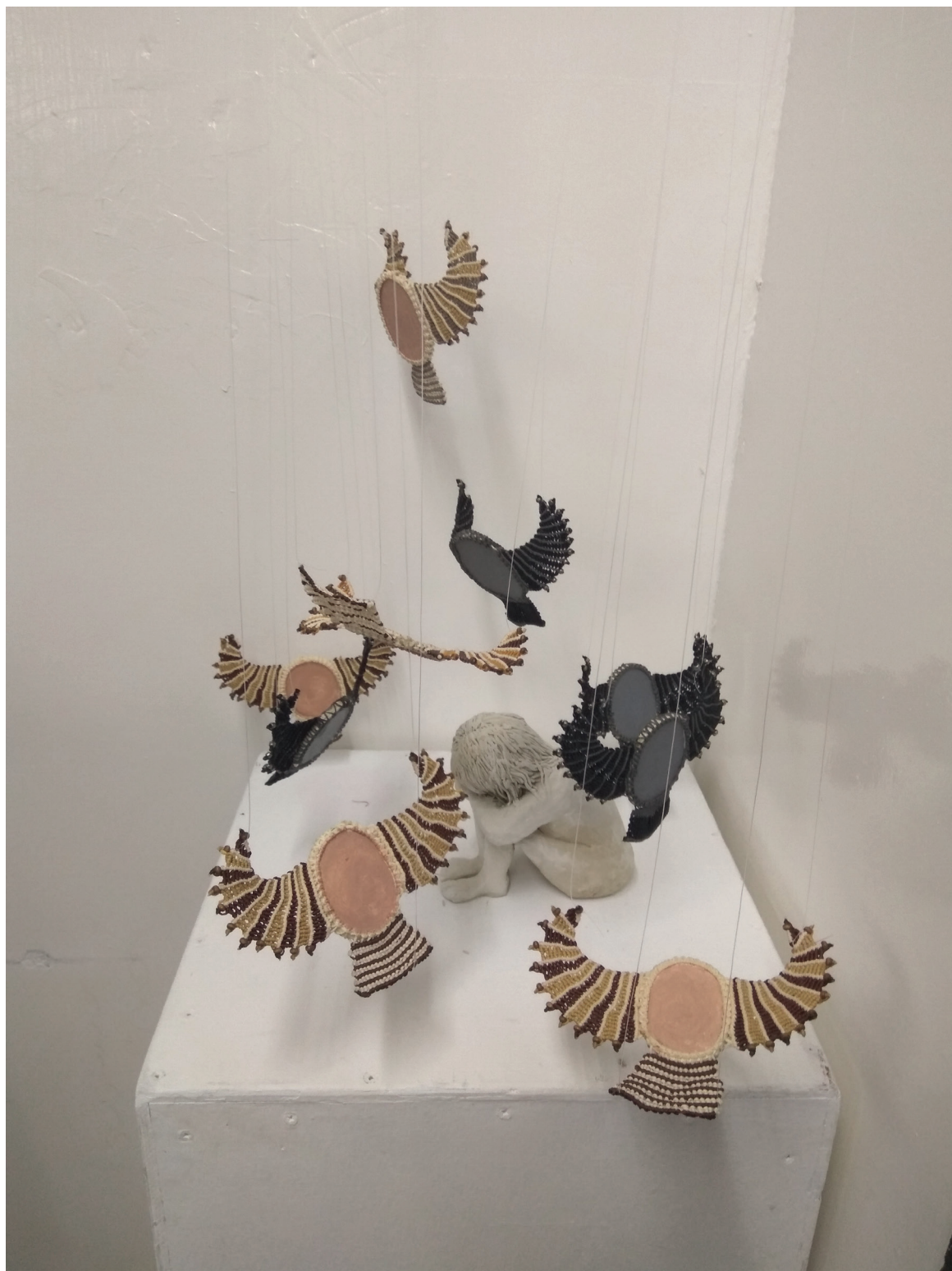
הם לא רק ילדים, בתיה גור, אולפנת נווה חנה (המורות: לביאה כהן ונעמה פז), מיצב, פיסול בחמר ובחוטים, 60 x 60 x 60 ס"מ.