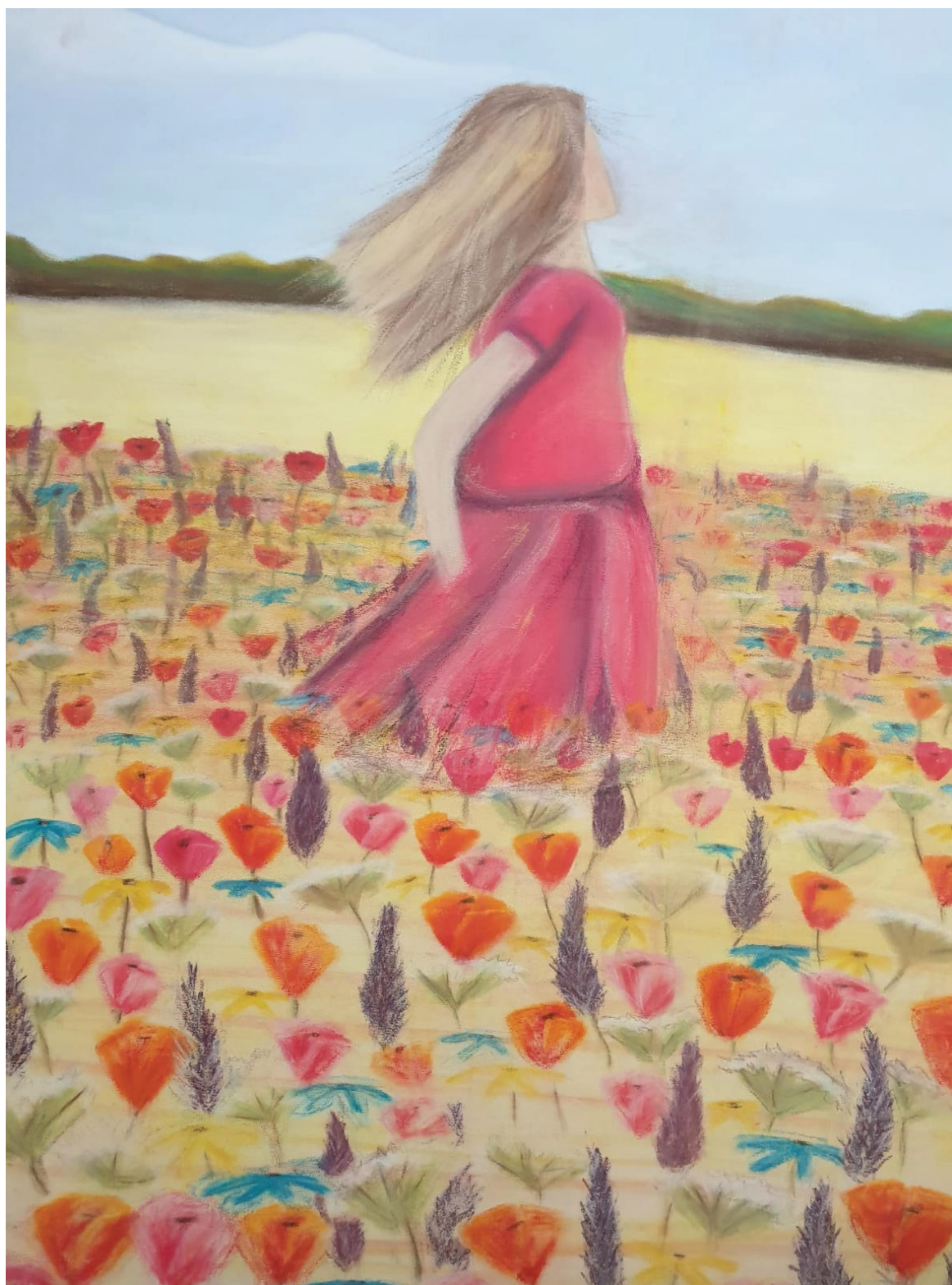
שנואה היא העצבות, אביה שמחון, אולפנת בקעת הירדן (המורה: תמר מיבסקי), רישומים בפחם ובפסטל.