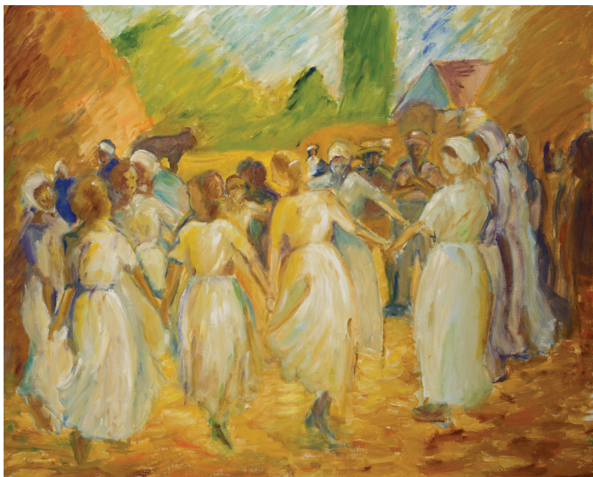
שמן על בד, 80x100