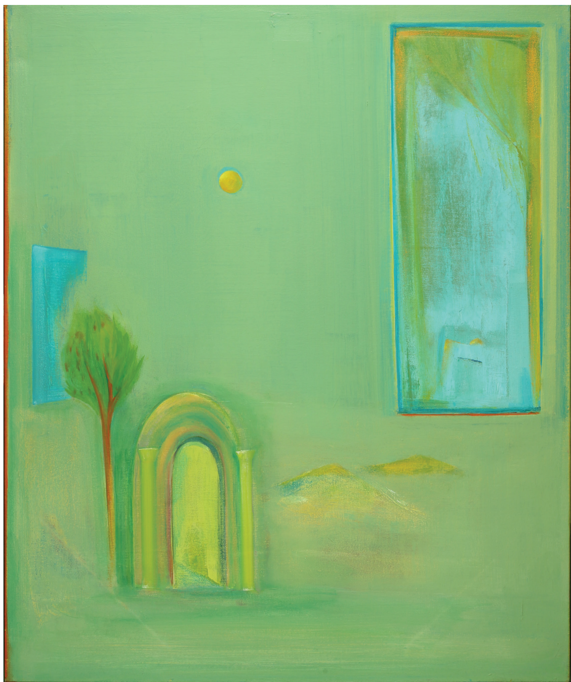
שמן על בד 75x90