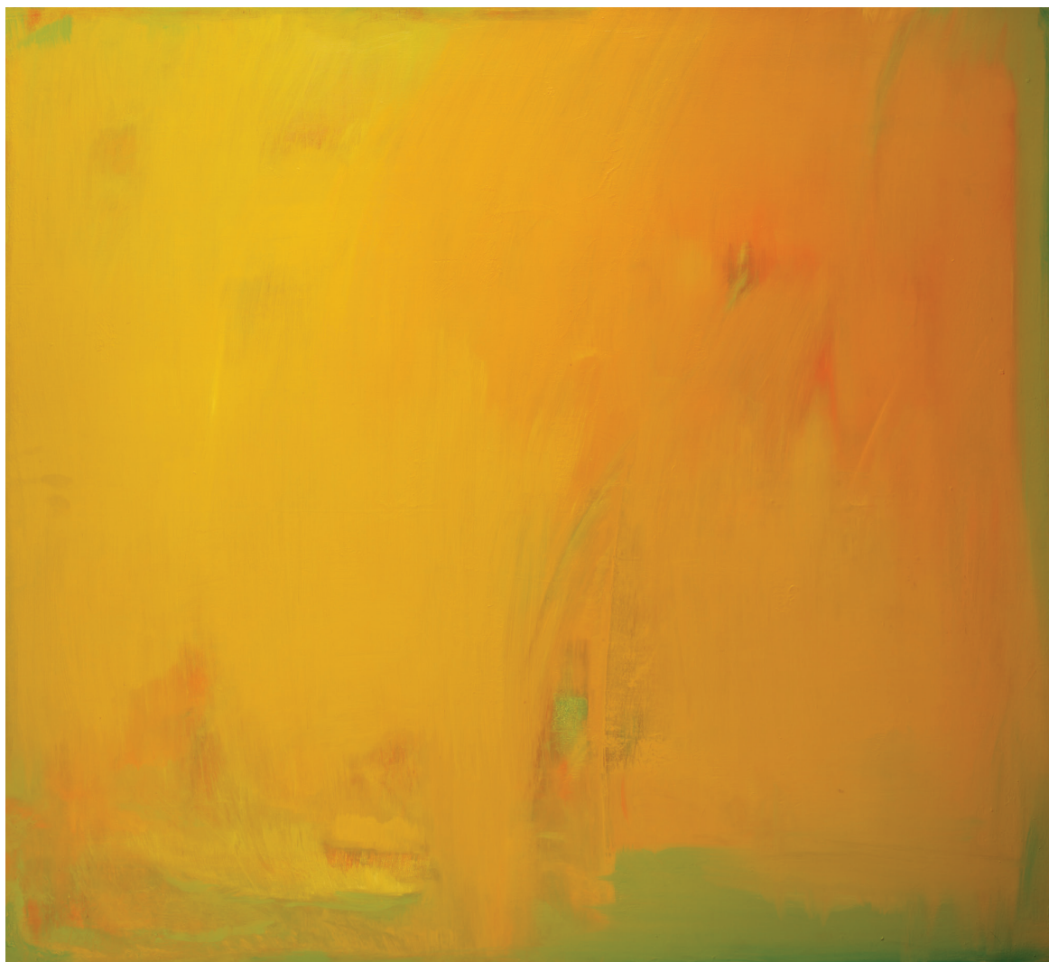
שמן על בד, 100X110