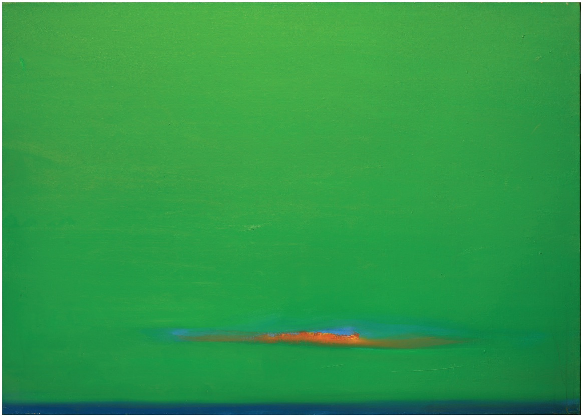
שמן על בד, 75X105