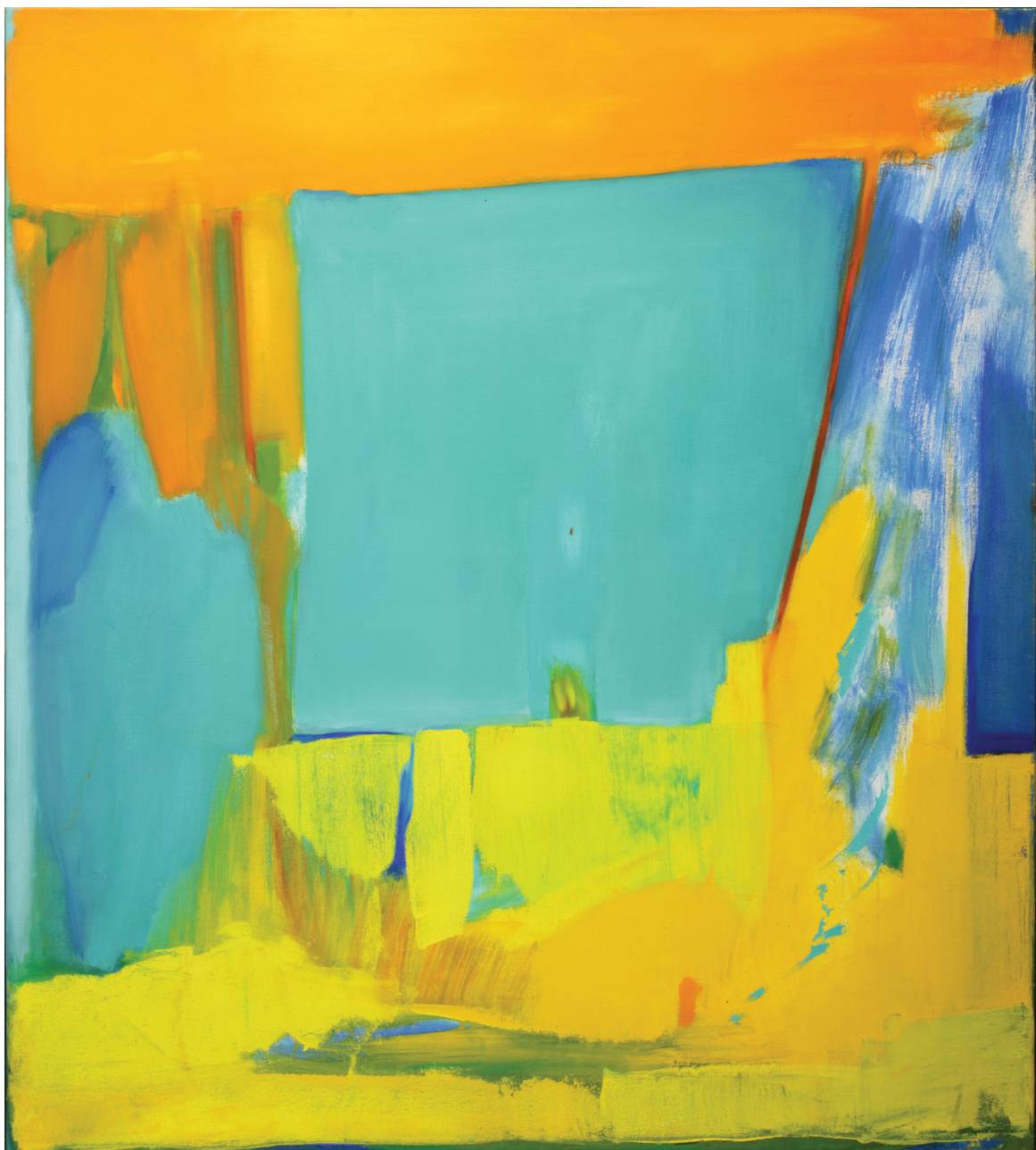
שמן על בד, 90x100