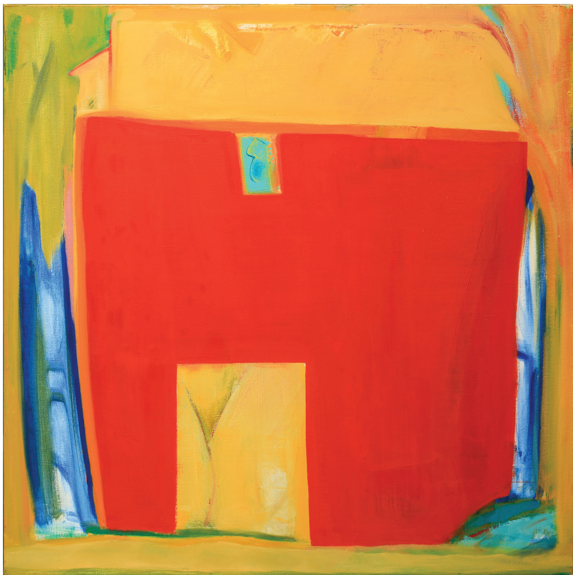
שמן על בד, 85x85