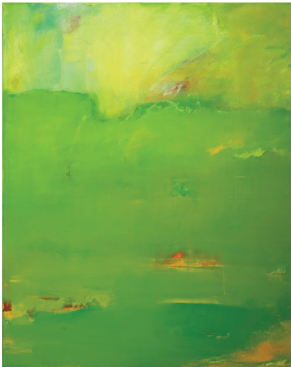
שמן על בד, 80x100