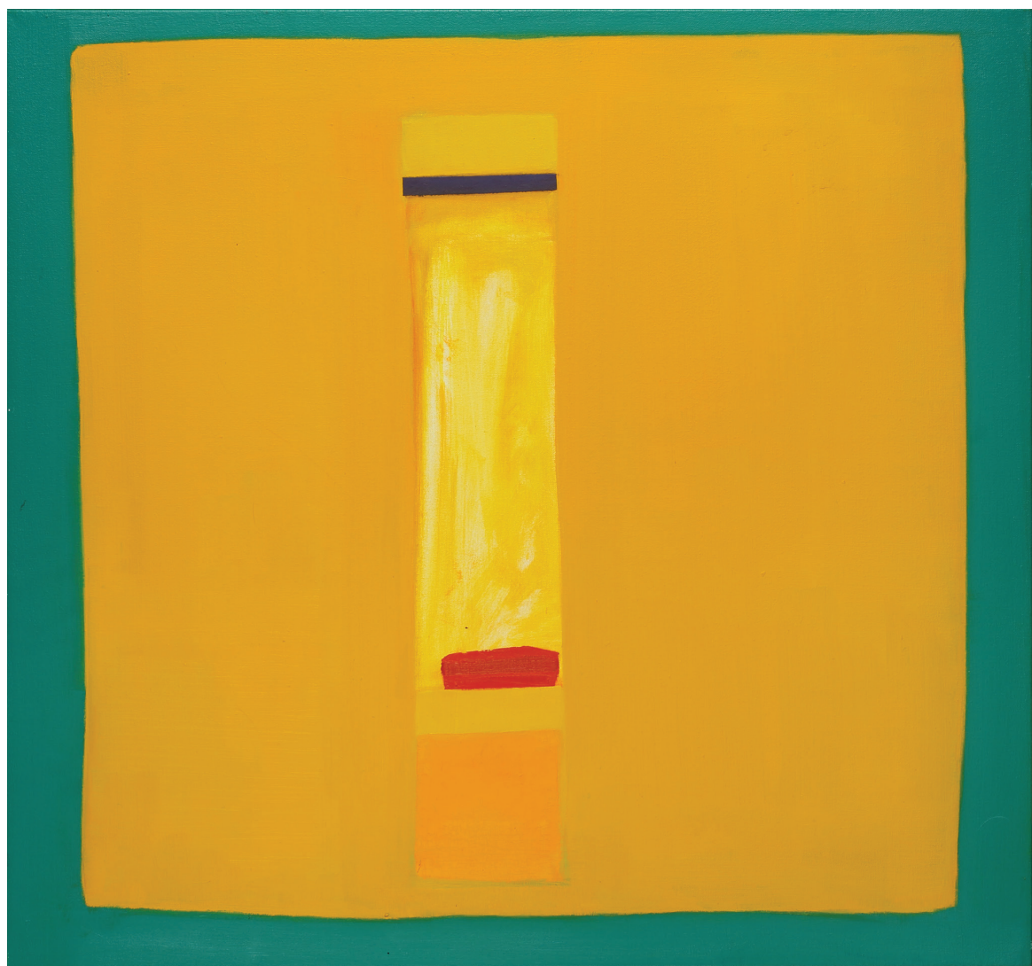
שמן על בוד, 75X70