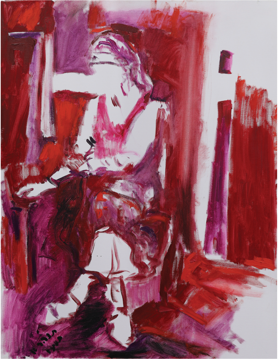
רישום בצבע, שמן על בד, 100 x 70 ס"מ