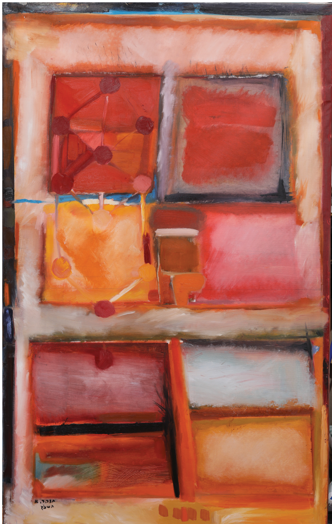
אבני החושן, שמן על בד, 105 x 170 ס"מ