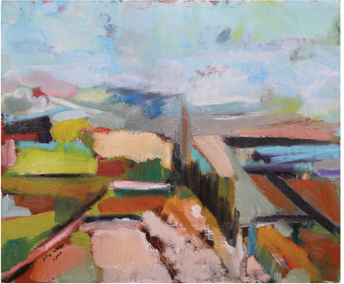
ציור נוף, שמן על בד, 100 X 120 ס"מ