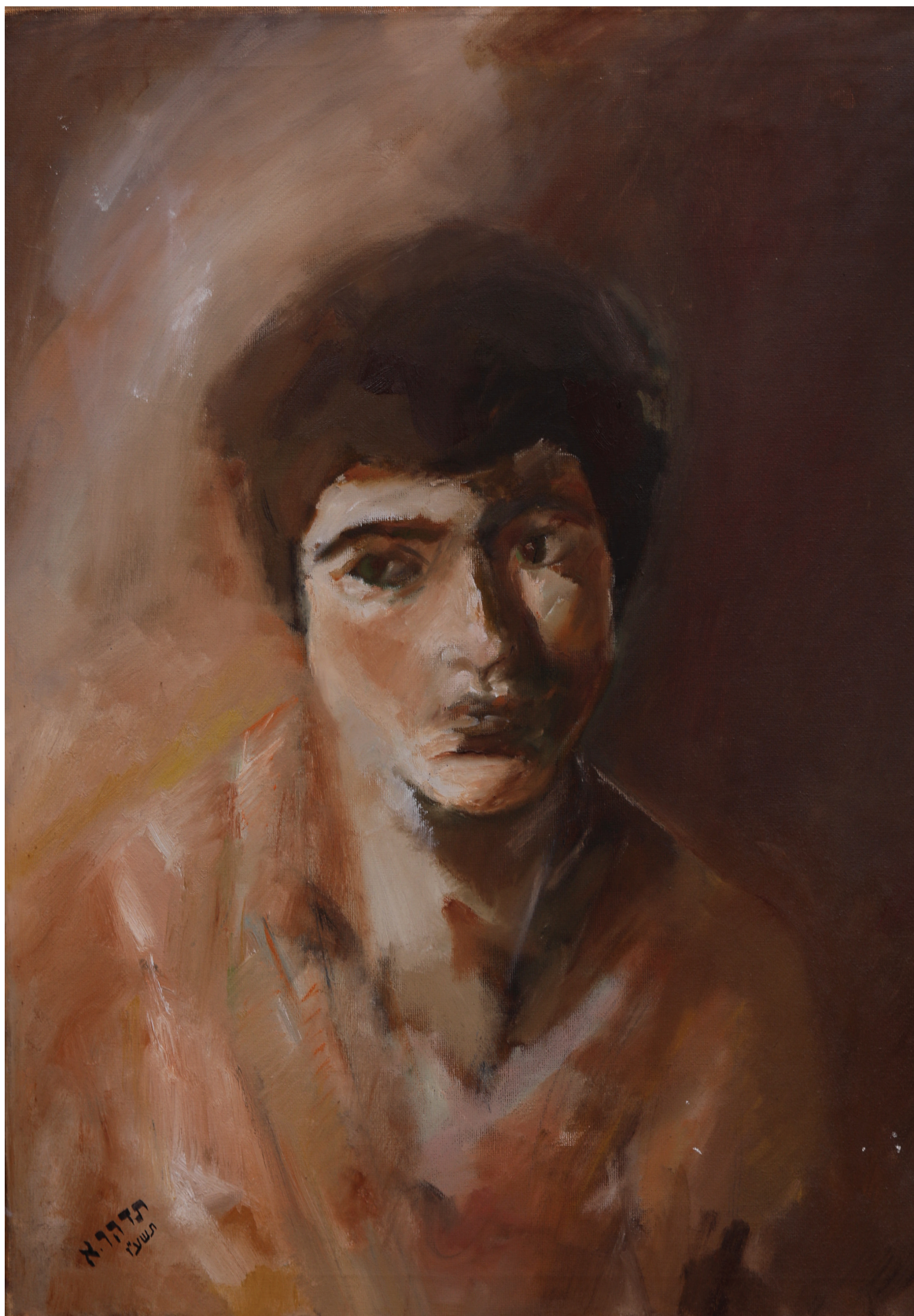
נער, שמן על בד, 50 x 60 ס"מ