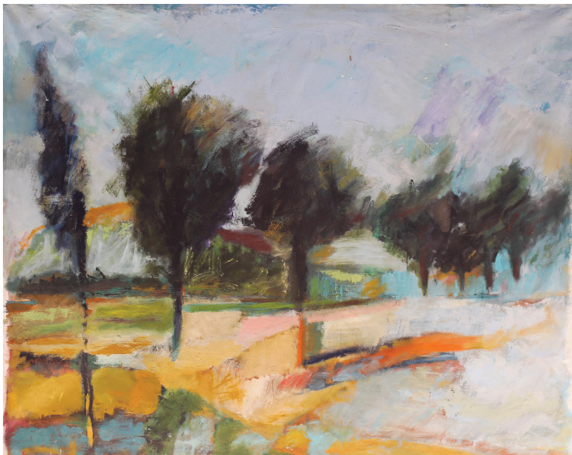
נוף בירושלים, שמן על בד, 200 x 155 ס"מ.