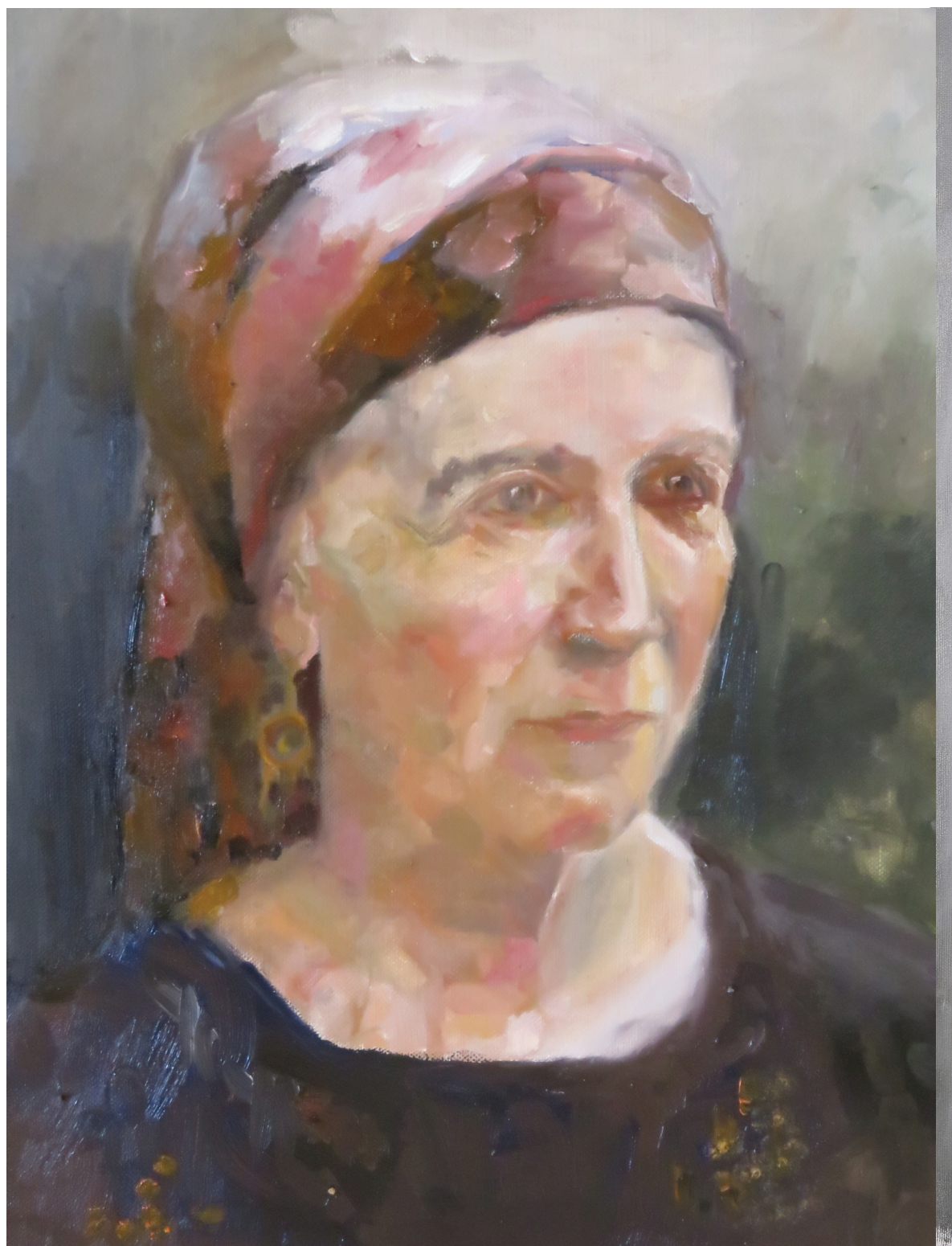
הרבנית איריס, שמן על בד מתוח על עץ, 60 x 50 ס"מ