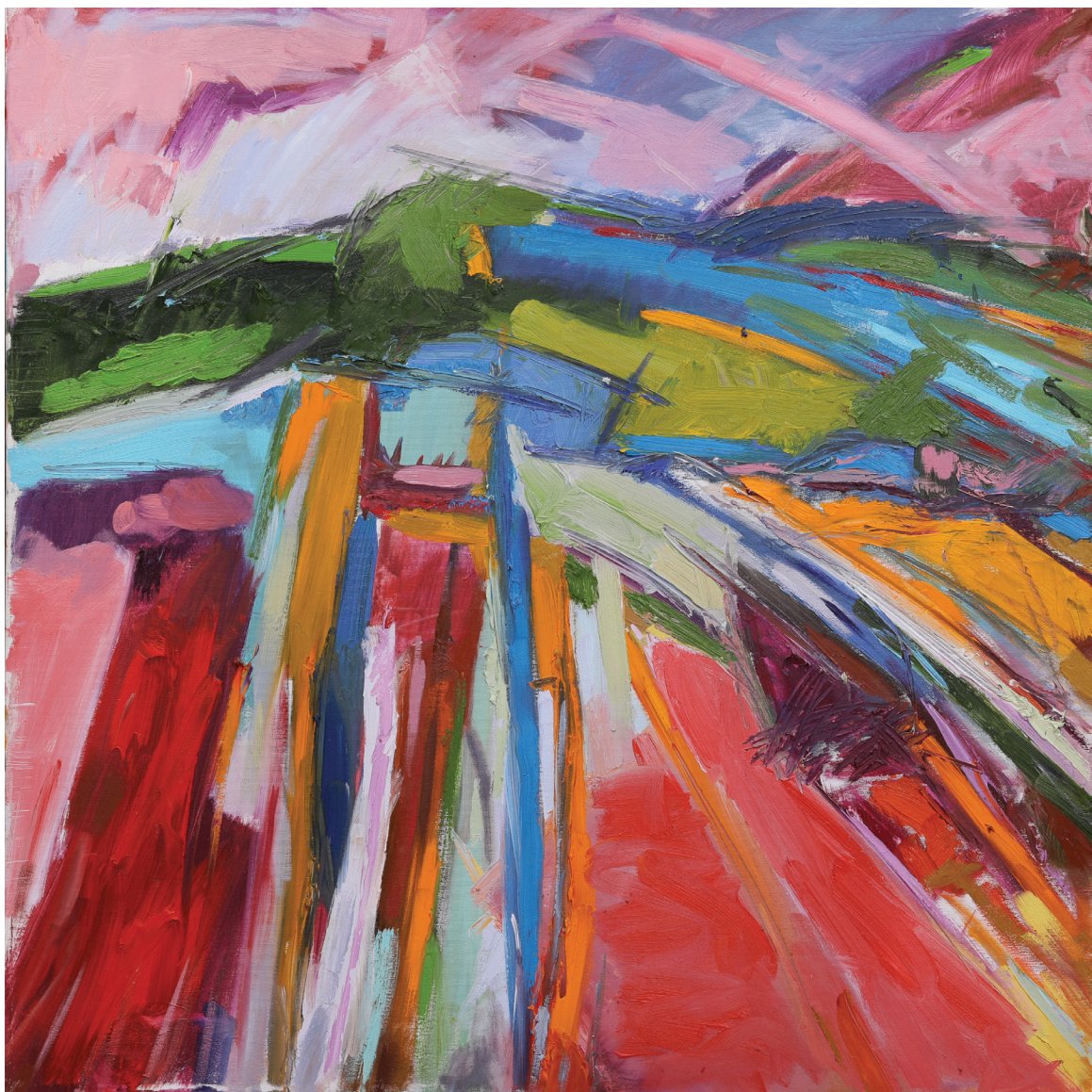
ציור נוף, שמן על בד, 100 x 100 ס"מ