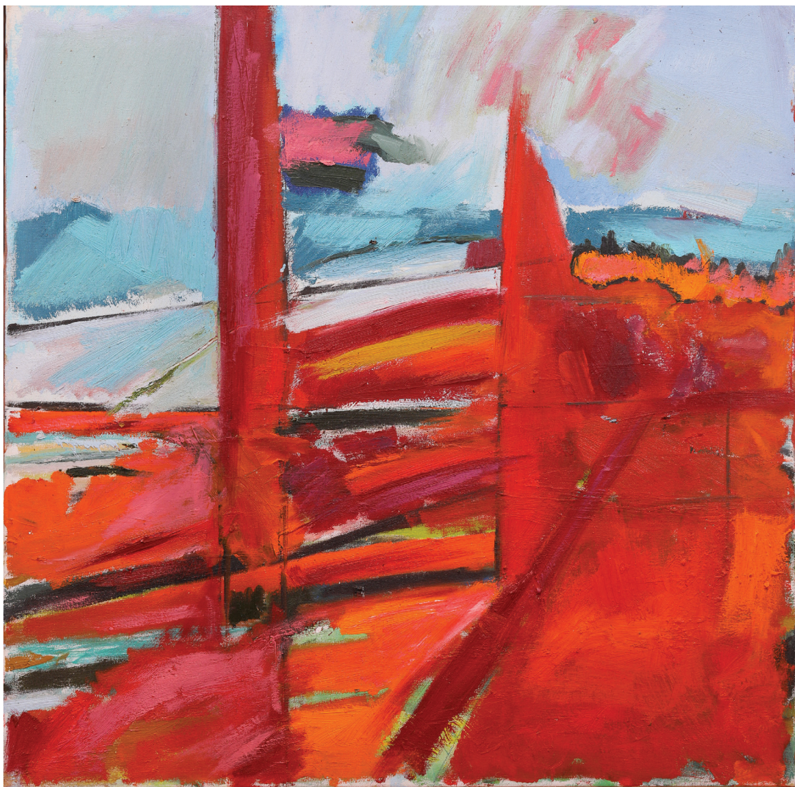
ציור נוף, שמן על בד, 100 x 100 ס"מ