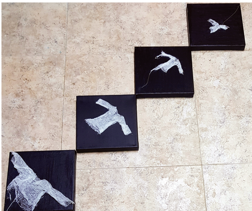
ארבע מעלות, אקריליק ותחבושת על קנווס, 2021.