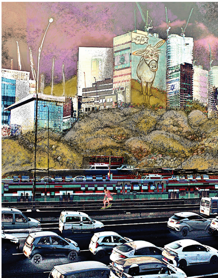
חמור באיילון, צילום וצויר מעובד, 2018.