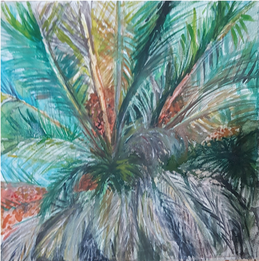
תמר, אקריליק על קנווס, 2020.