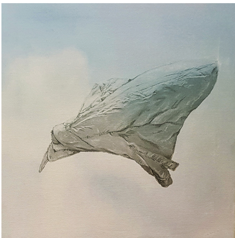
אוויר, מתוך "רביעיית יסודות עולם", צילום מעובד, 2018.