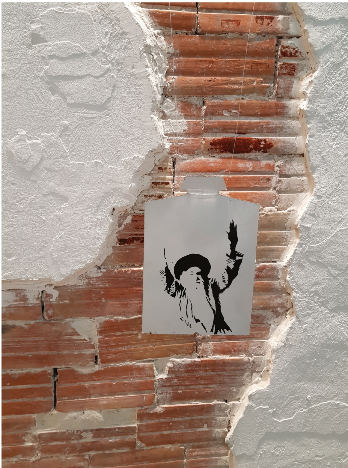
תלוי 2, הדפס שבלונה על קרטון קיפול חולצה.