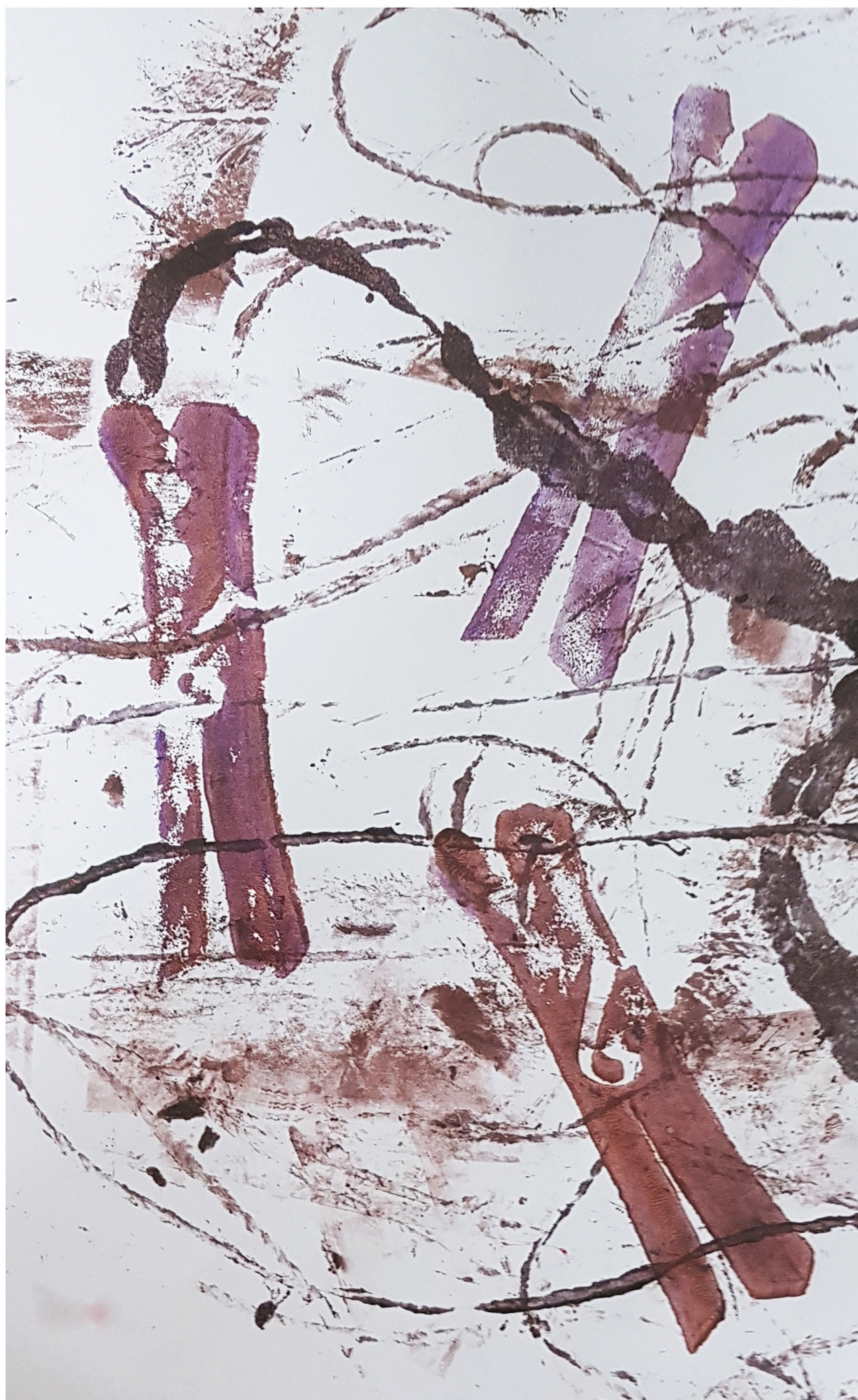
אטבים 2, הדפס שבלונה וחבלים על גבי נייר, 2020.