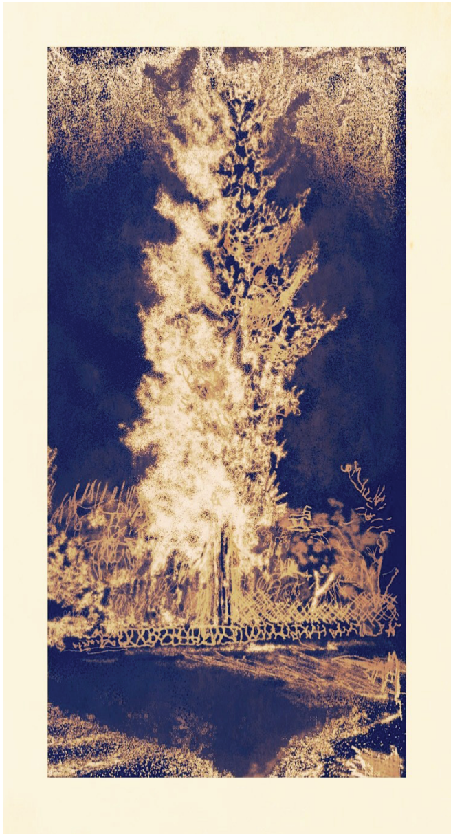
ברוש בלילה, ציור דיגיטלי, 2019.