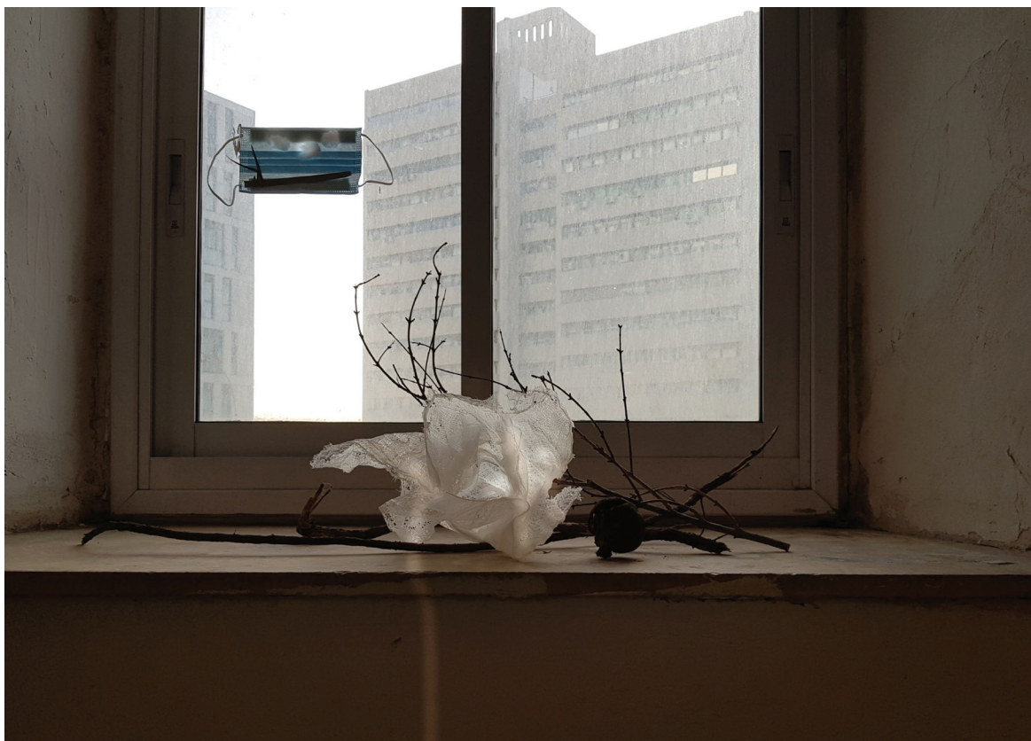
אדן חלון 2, פיסול בענפי רימון ותחבושת על אדן חלון, על החלון מסכה עם ענני צמר גפן, 2021.