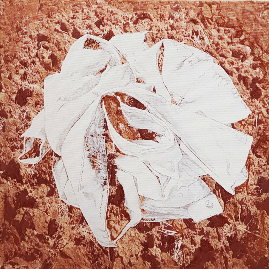
אדמה, מתוך "רביעיית יסודות עולם", צילום מעובר, 2018.