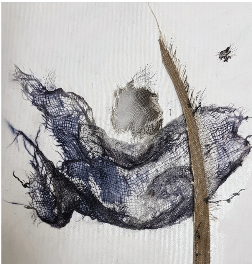
אור וחושך שלישייה I, אקריליק, דיו, תחבושת ופיסות קנווס.