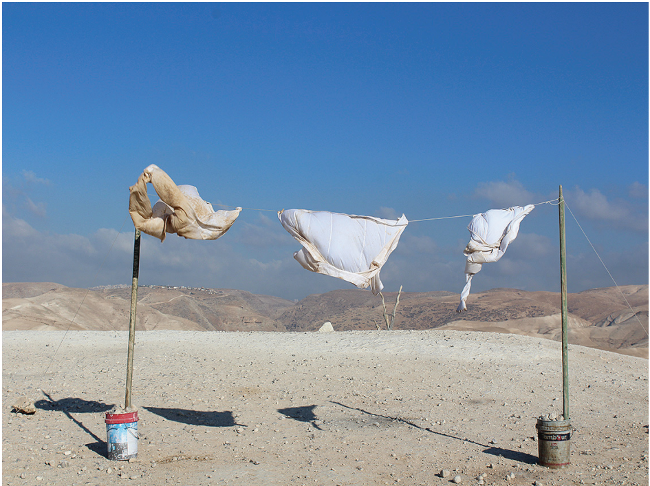
כביסה במדבר יהודה 8, צילום, 2018.