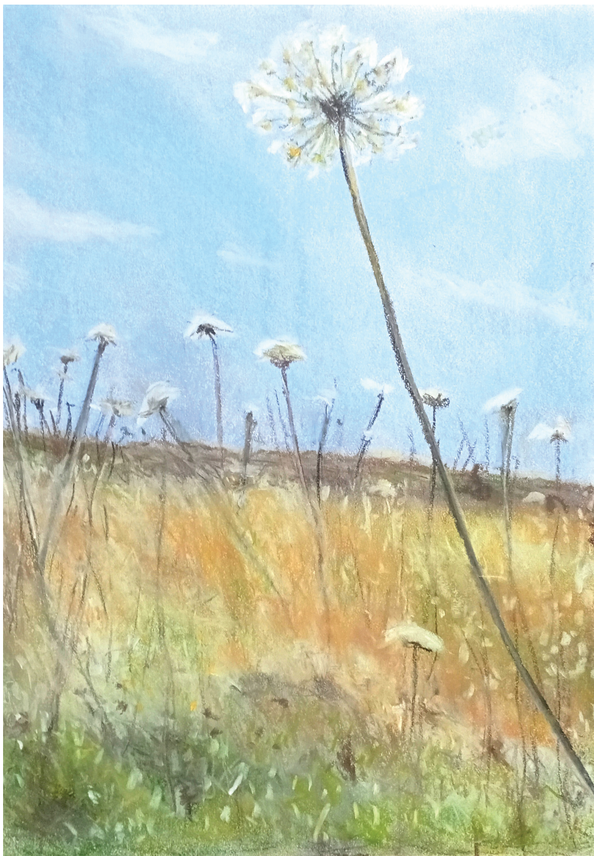
בשורת קיץ בדרך הביתה, פסטל על נייר, 2022