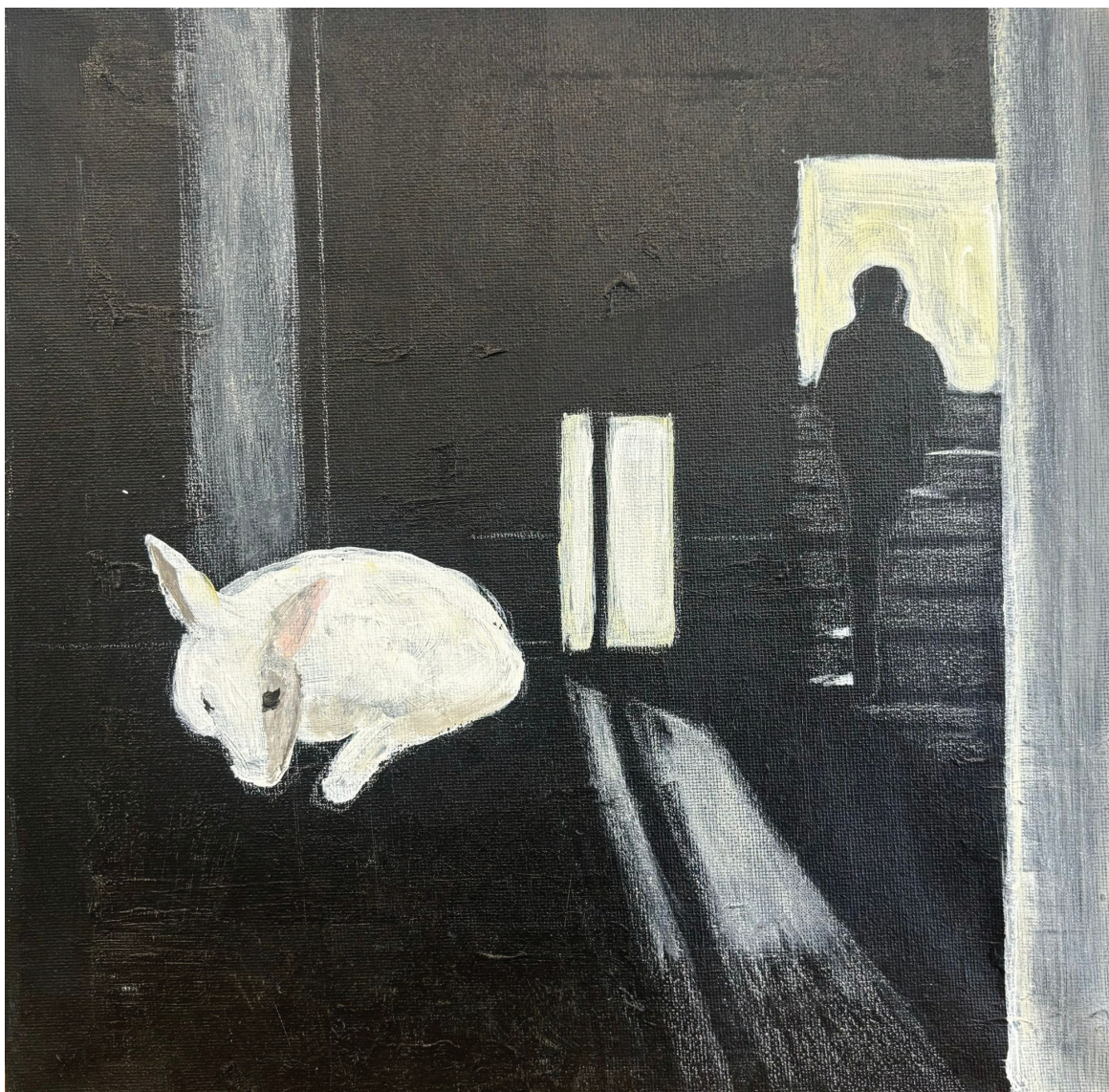
קומפוזיציה עם איש וארנב, אקריליק על בד, 2021