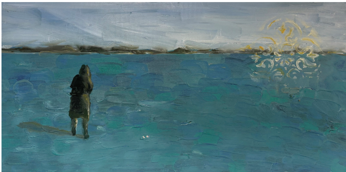
איך? אקריליק על בד, 2024