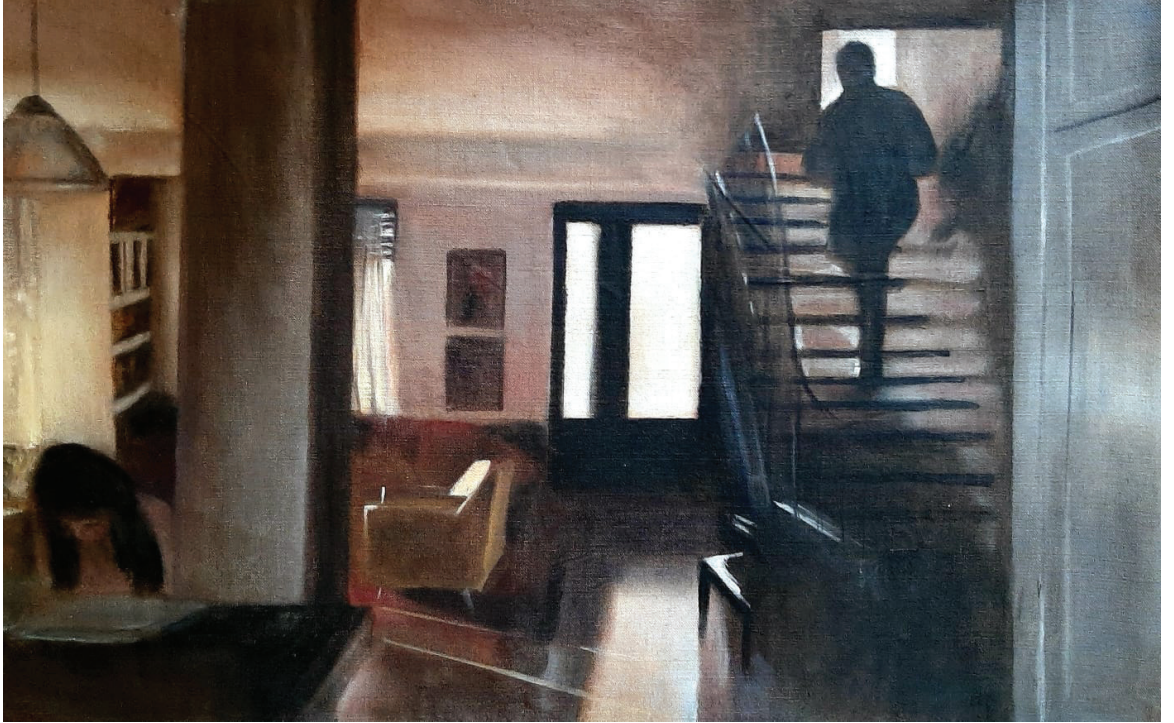
איש ובית, שמן על בד, 2021