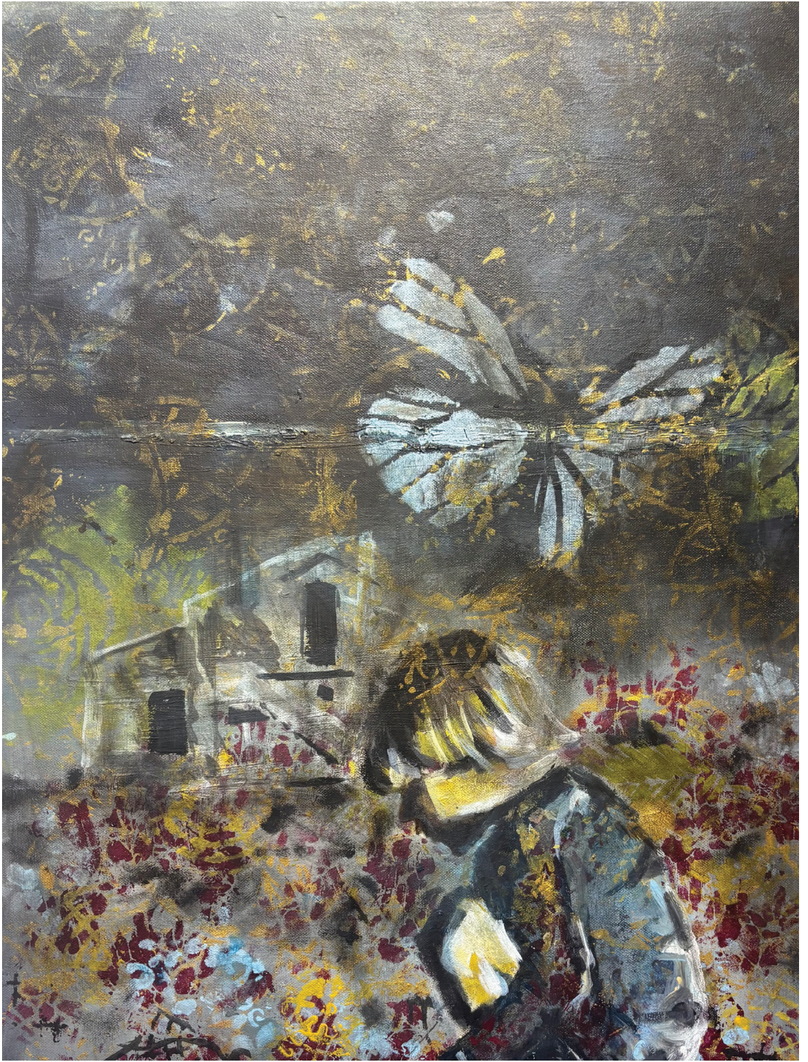
שרידים של תום, שמן ואקריליק על בד, 2025