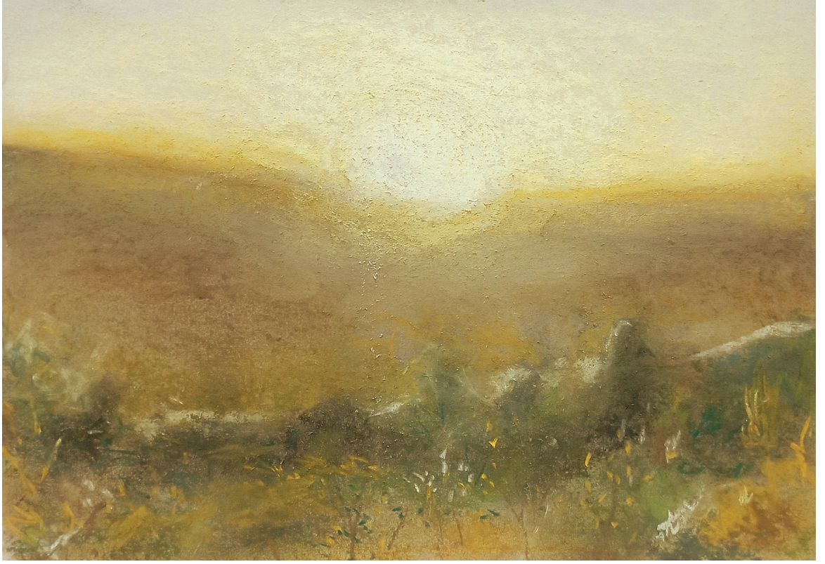
זריחה בתקוע, פסטל על קרטון, 2022