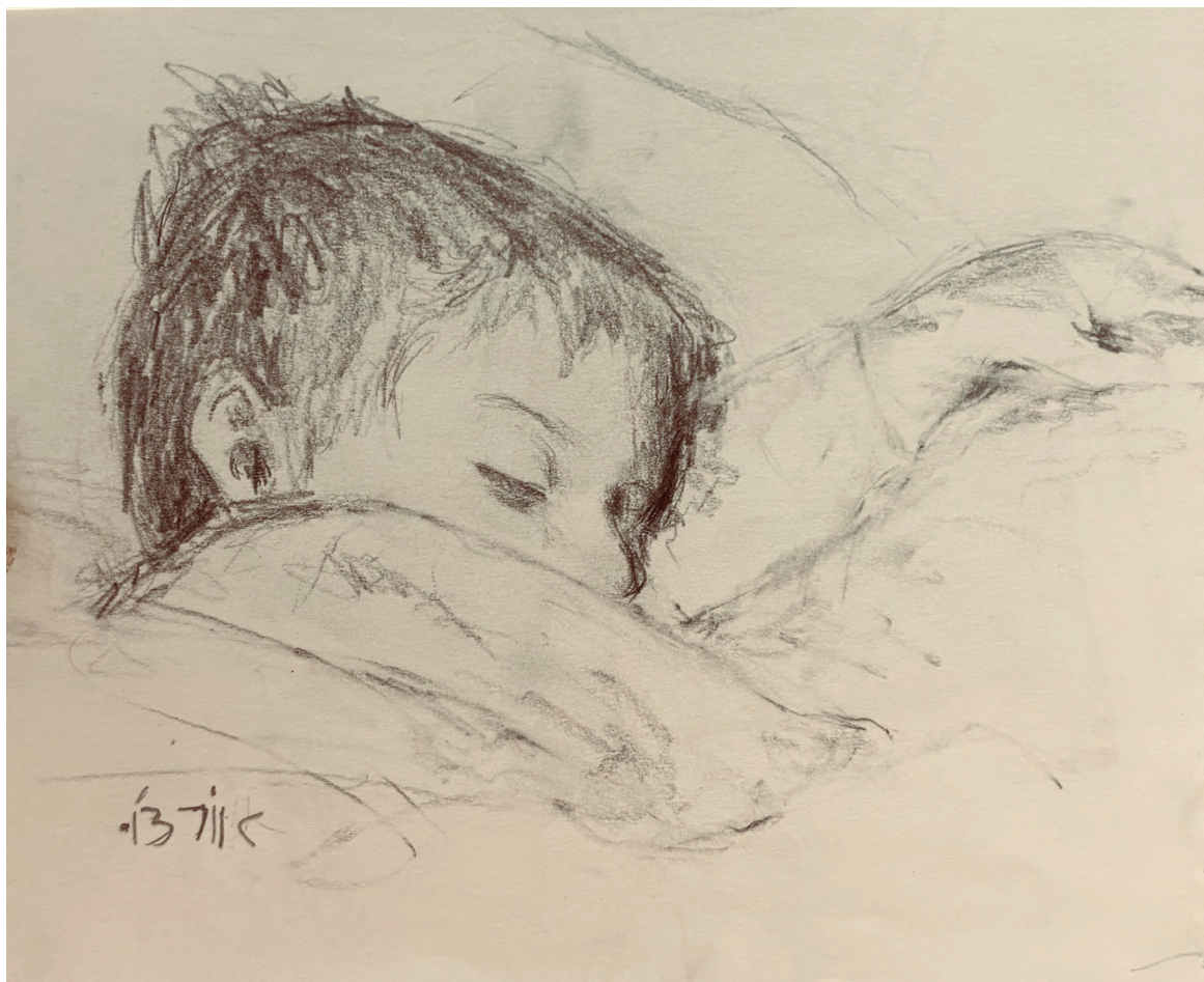
אורצ'ו, עיפרון על נייר, 2013