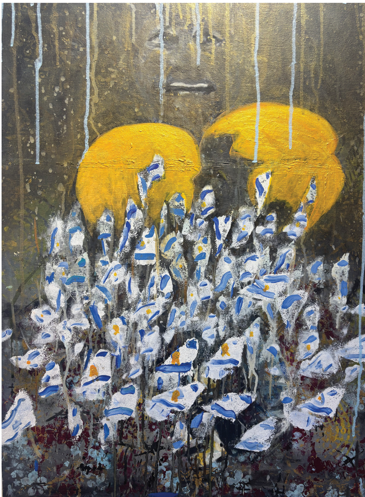
זעקי ארזי, בכו שמים, אקריליק על בד, 2025